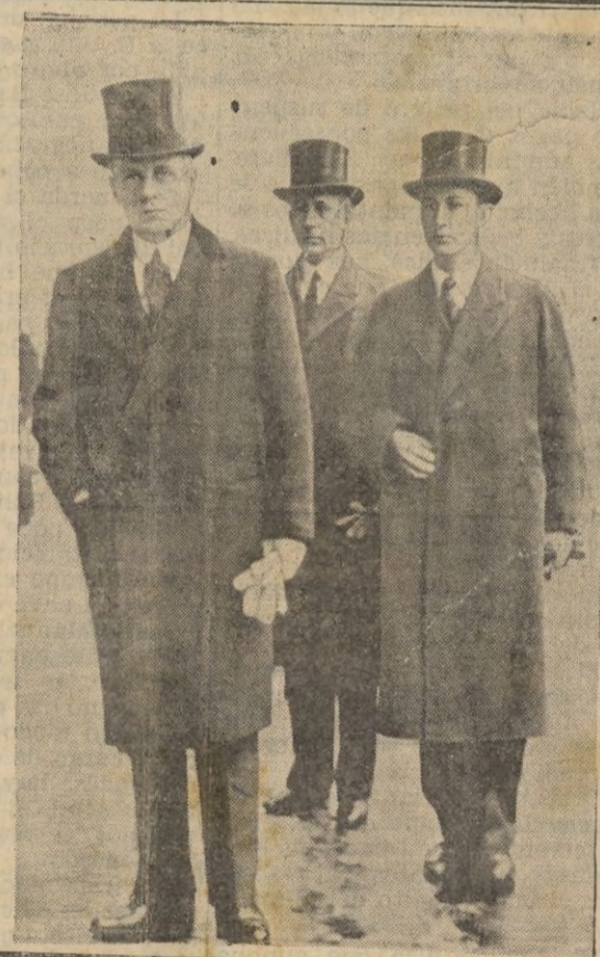
El jefe de la delegación alemana, Herr Von Ribbetrof, saliendo de visitar al rey Eduardo VIII de Inglaterra, que le recibió en el palacio de Buckingham