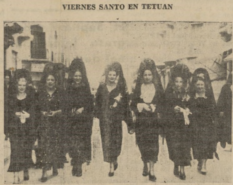
Grupo de bellísimas señoritas saliendo de los actos religiosos celebrados en el templo de Nuestra Señora de las Victorias

CARNECERIA VALENCIANA DE VICENTE MANUEL Ternera. Cerdo. Vaca. Cordero. HCACINAS.-Siempre encontrará la carne fresca Plaza del Mercado (Cajón n. 33)