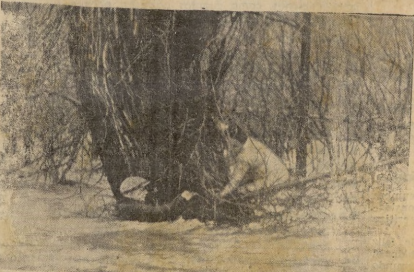
Una fotografía de las inundaciones en América que demuestra en qué forma tuvieron que resguardarse algunos para no ser arrastrados por las aguas