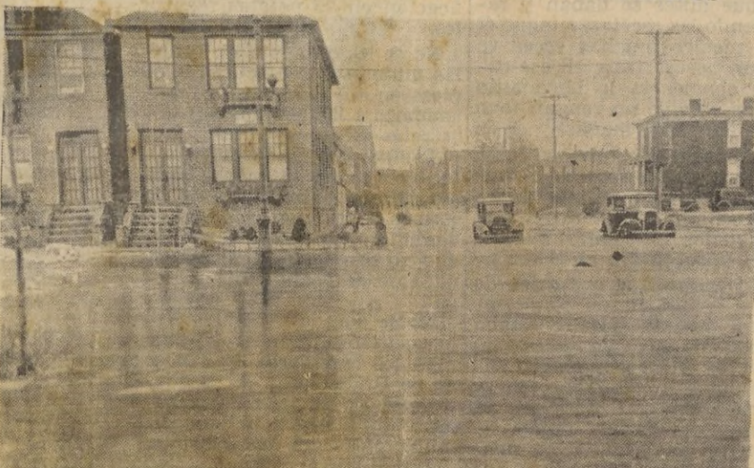
Los deshielos han provocado en toda la parte del Atlántico de los Estados Unidos gravísimas inundaciones. Las primeras noticias elevaban a más de cien el número de muertos y las pérdidas a una cifra de millones. La foto muestra una calle

mentar las propuestas francesas y dice que el plan produce la impresión de un segundo tratado de Versalles queriendo imponer todas las vejaciones a los alemanes.