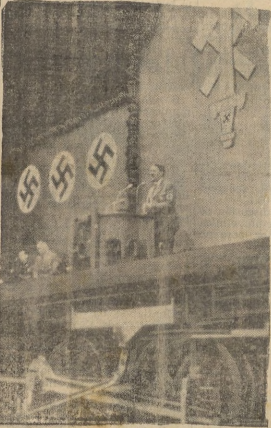
Un momento del discurso pronunciado por Hitler en la sala de locomotoras y forjas de las fábricas Krupp de Essen