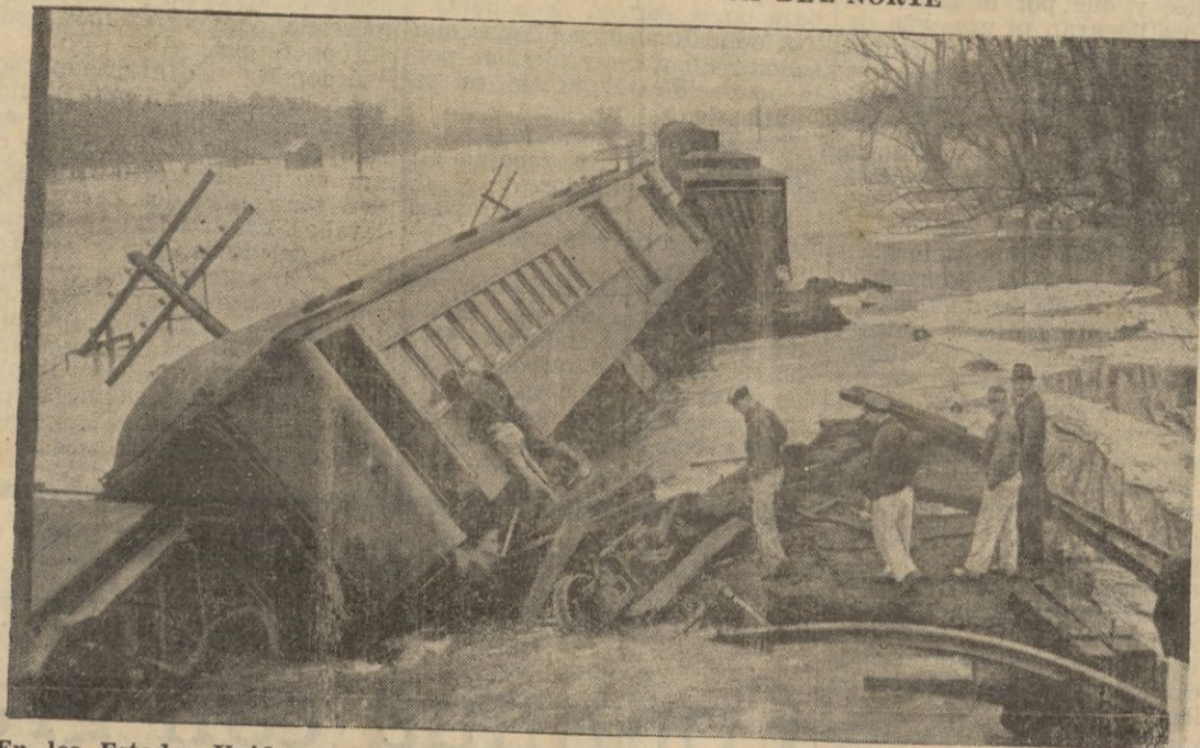
En los Estados Unidos, sobre la zona del Atlántico, las inundaciones han producido verdaderos desastres. En las cercanías de Nueva Jersey, por haber sido barrido la vía del ferrocarril este expres

el Comité continuará reunido hasta el fin de esas conversaciones.