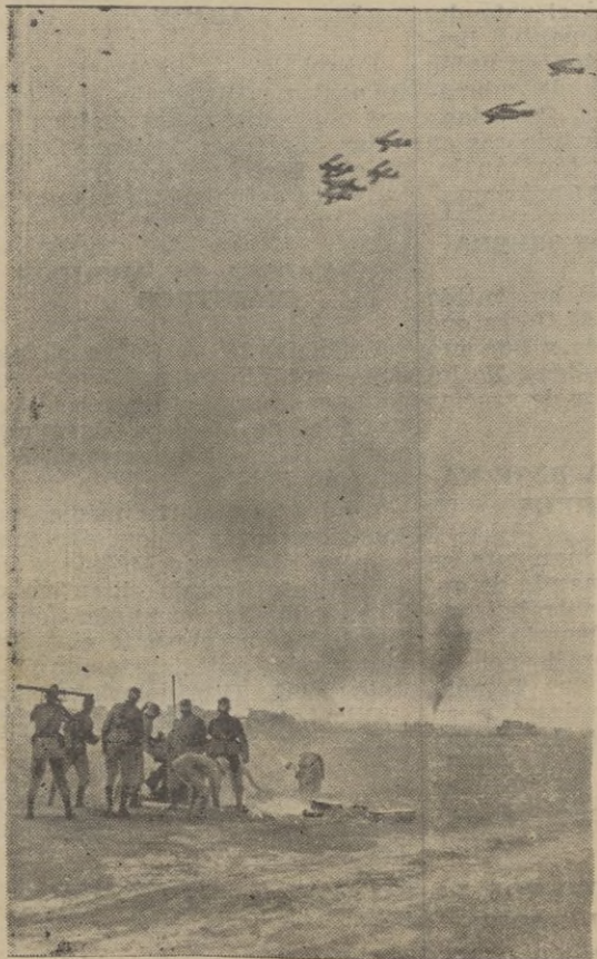
La aviación del Reich está en pleno plan de maniobras. En esta foto se ve un simulacro de ataque de una escuadrilla en las cercanías de Staaken.