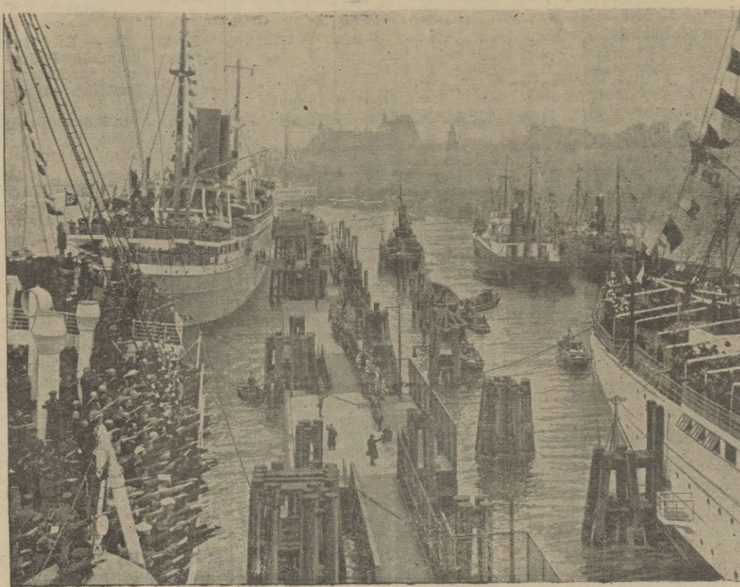
En el puerto de Hamburgo tres vapores de la Asociación "Fuerza por la Alegria" han embarcado cerca de 5.000 obreros que van a la Isla de Madera a pasar quince días de vacaciones. La foto muestra el momento de la salida.