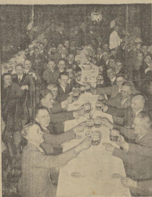
El general Goering ha invitado en Berlín a los cuatros mil obreros de Berlín al valle de Joachim. Una foto parcial del acto.