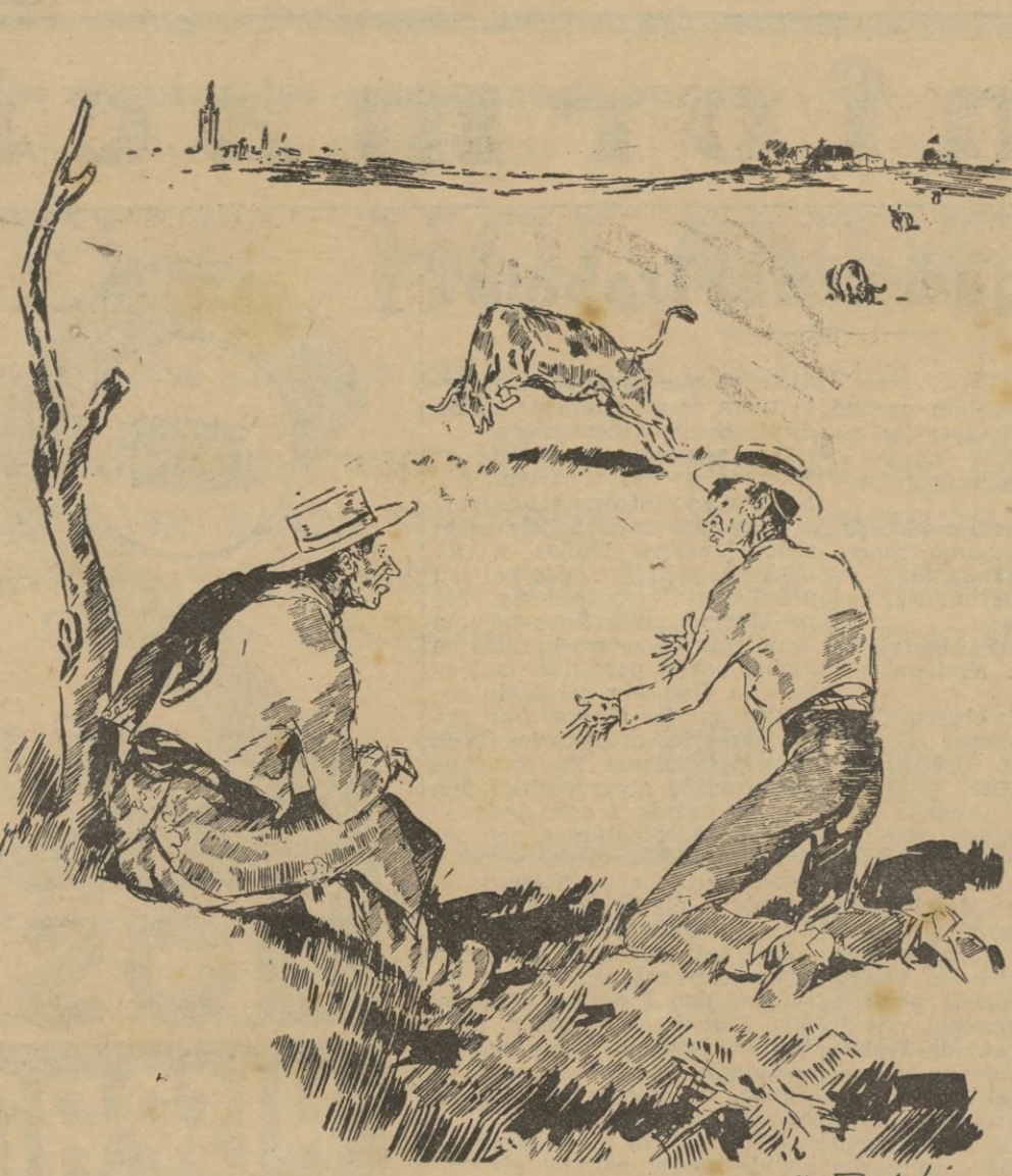
DOLOR DE MADRE, por Martínez de León. — ¡Que le pasa a la "Pinta" que rebrinca tanto! — ¡No, home! ¡La Radio que te lo charla y acaba de decir que le están logueando un hijo suyo en Barcelona!

Escuche Vd. los famosos Philips "todas las ondas", "Receptodo" y "Nautilus", que reciben extraordinaria musicalidad todas las emisoras del mundo.