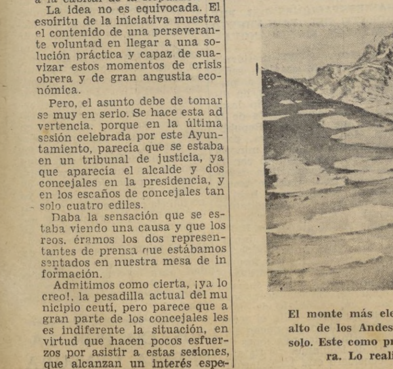
El monte más elevado de America, el Anconagua, el pico más alto de los Andes Argentinos, ha sido salvado por un alpinista solo.