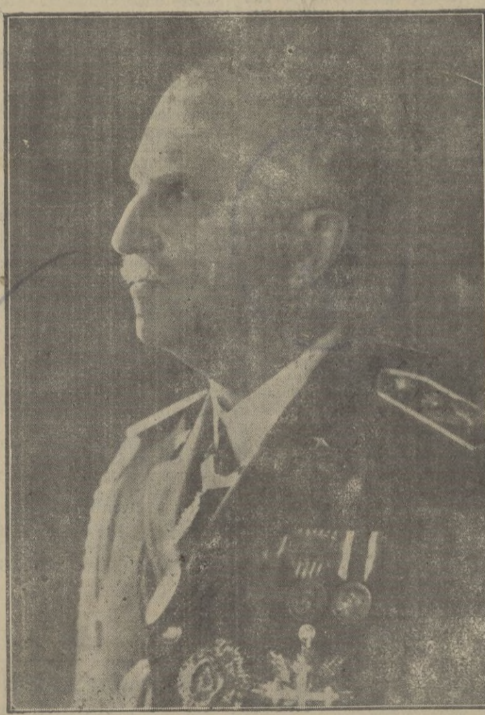
S. M. El Rey de Italia y Emperador de Etiopía, augusta figura que encarna las virtudes del noble pueblo italiano y cuya magnanimidad es símbolo de la nobleza de su raza.

España contribuyó, en la antigüedad, como ninguna provincia al esplendor de Roma; hoy Italia lo ha devuelto con la sangre de sus voluntarios