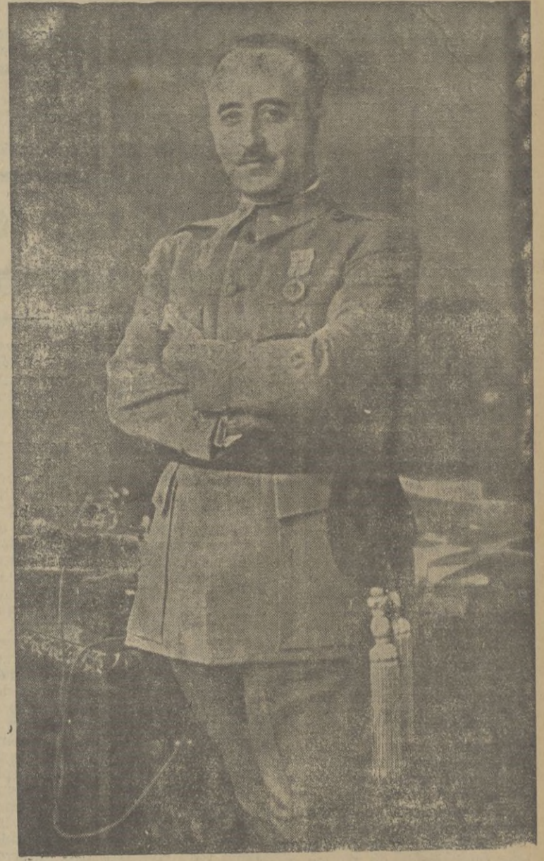
S. E. el Jefe del Estado Español y Generalísimo de los Ejércitos Nacionales, Caudillo invicto de la Patria que ha decidido el regreso a su país de los heroicos voluntarios italianos, que durante más de dieciocho meses han luchado en nuestro suelo por la Causa de Dios y de la civilización.

La España Nacional despide a los bravos legionarios italianos con la voz emocionante de su corazón que les dice: "Estaréis presentes siempre en el pensamiento de la Raza."