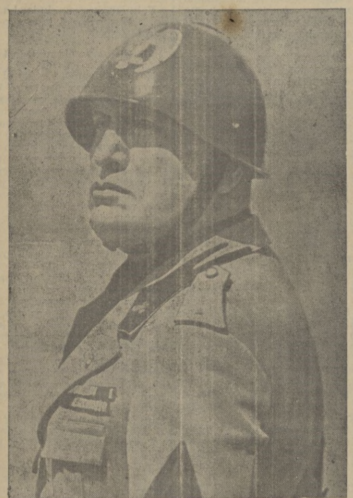
El Duce de la Italia triunfal, Benito Mussolini, forjador de un nuevo Imperio, alma del fascio y artífice de la paz, que conduce a su pueblo por la vía recta de su máxima prosperidad.

España contribuyó, en la antigüedad, como ninguna provincia al esplendor de Roma; hoy Italia lo ha devuelto con la sangre de sus voluntarios