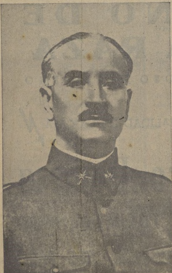
El heroico general Queipo de Llano que tan eficazmente ha colaborado en la liberación total de España

Hoy salió, por primera vez, la Virgen querida del pueblo murciano "La Fuansanta", siendo llevada en procesión a través de las calles, para ser llevada a su trono de plata, deteriorado por los rojos. Millares de personas asistieron al Santo Sacrificio de la Misa recordando con emoción a los caídos