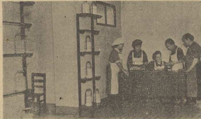
La jefa de la Cocina y las camaradas del Servicio preparan los menús del día

Auxilio Social de Ceuta, siempre atento a cuanto en favor del necesitado pueda hacerse, y en relación con