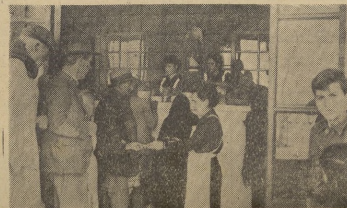
Antes de llegar al mostrador son picadas las tarjetas

Nuestra fotografía de la fachada, y la otra en que la camarada Jefa pica con su sacabocados las tarjetas de la comida, son una prueba fehaciente de la admirable labor realizada por todos