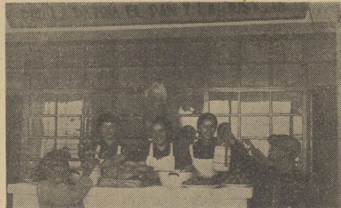
Llenas de alegre espíritu nacional sindicalista, las camaradas de Auxilio Social, sirven las raciones

tores, como ésta con el personal a su servicio, formula los menús que han de ser condimentados para el día.