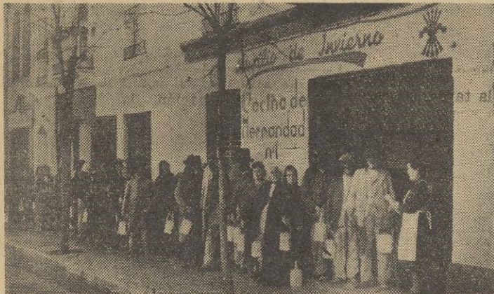
Fachada del local en que se halla instalada la Cocina de Hermandad

Desde luego hay una prueba rotunda, de que el servicio es abundante, que la razón, alegan que no han ido a por varios socorridos, y al preguntársele que en el reparto de la tarde, faltan consiste en la observación hecha de