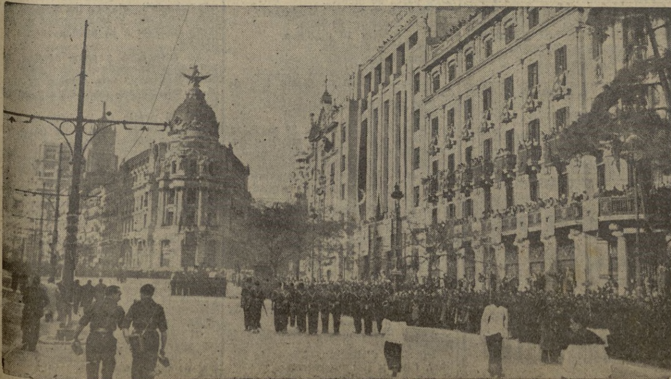
El paso de la comitiva que conduce los restos del Fundador de la Falange, por la Avenida de José Antonio.

"Que Dios nos niegue el descanso... --parecía misteriosamente escrito en el crepúsculo de esta tarde-- hasta que sepamos recoger la cosecha que siembra tu muerte".