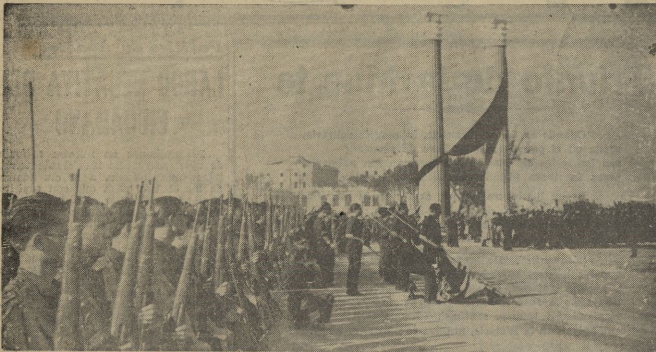
LOS RESTOS DE JOSE ANTONIO A SU PASO POR MADRID. -- En terreno de la Ciudad Universitaria, las fuerzas de tierra, mar y aire entregan el cadáver a los camaradas del S. E. U. que le rinden su más fervoroso homenaje.