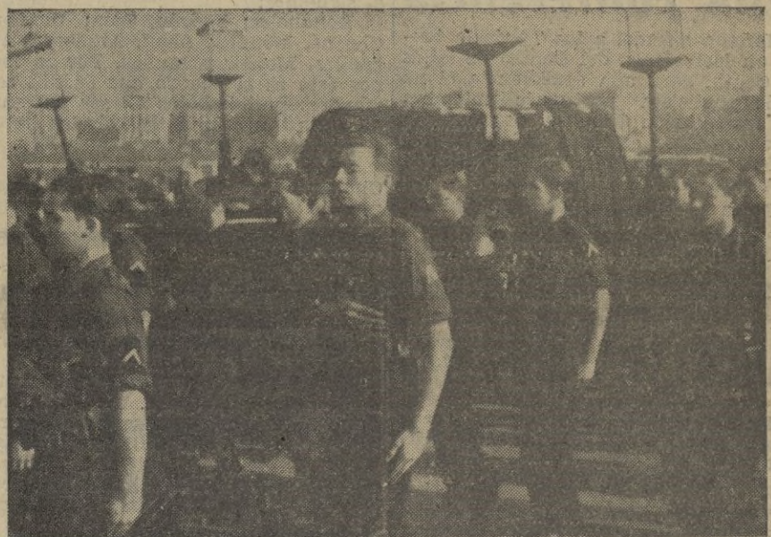
TRASLADO DE LOS RESTOS DE JOSÉ ANTONIO A EL ESCORIAL. --El cortejo, camino de El Escorial, en la última etapa.