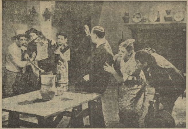
He aquí una de las escenas de la película basada en la obra de don Pedro Muñoz Seca.

¡TRABAJADORES DEL CAMPO Y DE LA GANADERIA CON DERECHO AL SUBSIDIO FAMILIAR! Inscribíos inmediatamente ante la Junta Municipal de vuestro Ayuntamiento para poder percibir el Subsidio que el Caudillo os ofrece.