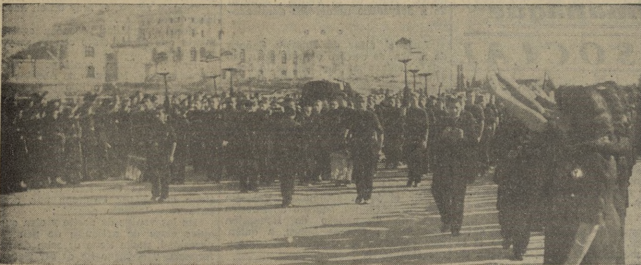
Y la comitiva continúa, cruzando los terrenos de la Ciudad Universitaria, hacia El Escorial.