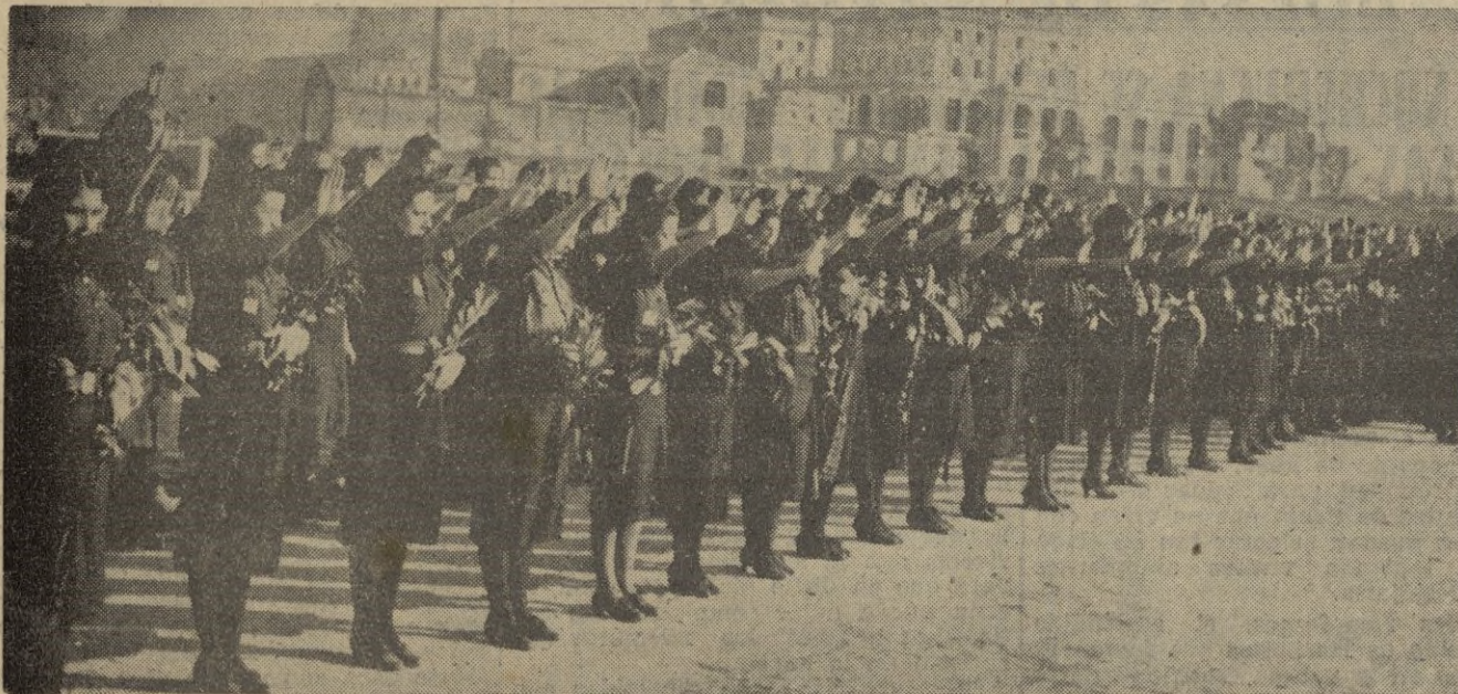
Las camaradas del S. E. U. rinden su homenaje a los restos de José Antonio en terreno de la Ciudad Universitaria.