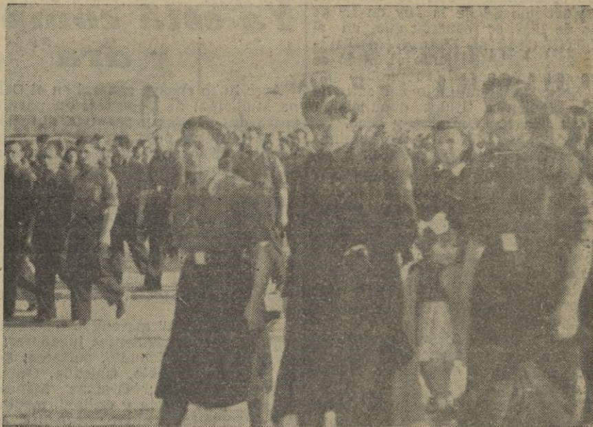
Pilar Primo de Rivera caminando por la carretera de El Escorial detrás de los restos de su hermano.

Se calcula que asistieron a estos actos ciento cincuenta mil falangistas, que, con la visión imborrable del histórico funeral, regresaron sobrecogidos a Madrid.