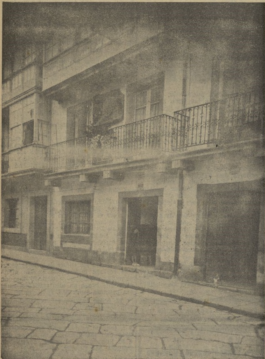
En esta casa, número 108 de la calle María, de El Ferrol del Caudillo, nació --en el piso tercero -- S. E. el Jefe del Estado