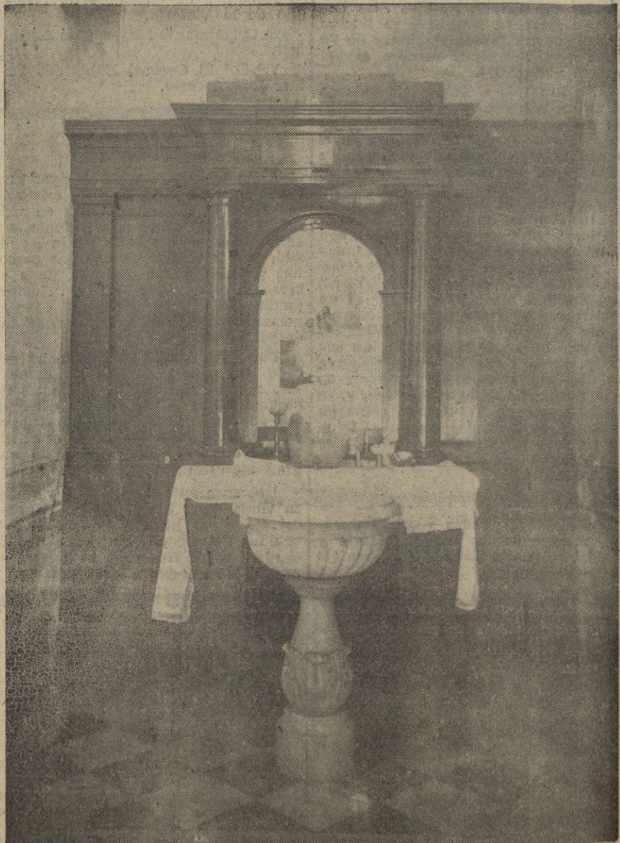
Y, en esta pila las aguas generosas del cristianismo, se vertían sobre la cabeza que concibió en otra fecha histórica -- 18 de Julio de 1936 -- la mayor proeza de los siglos: librar a España y a Europa del barbarismo vandálico de los sin Dios.