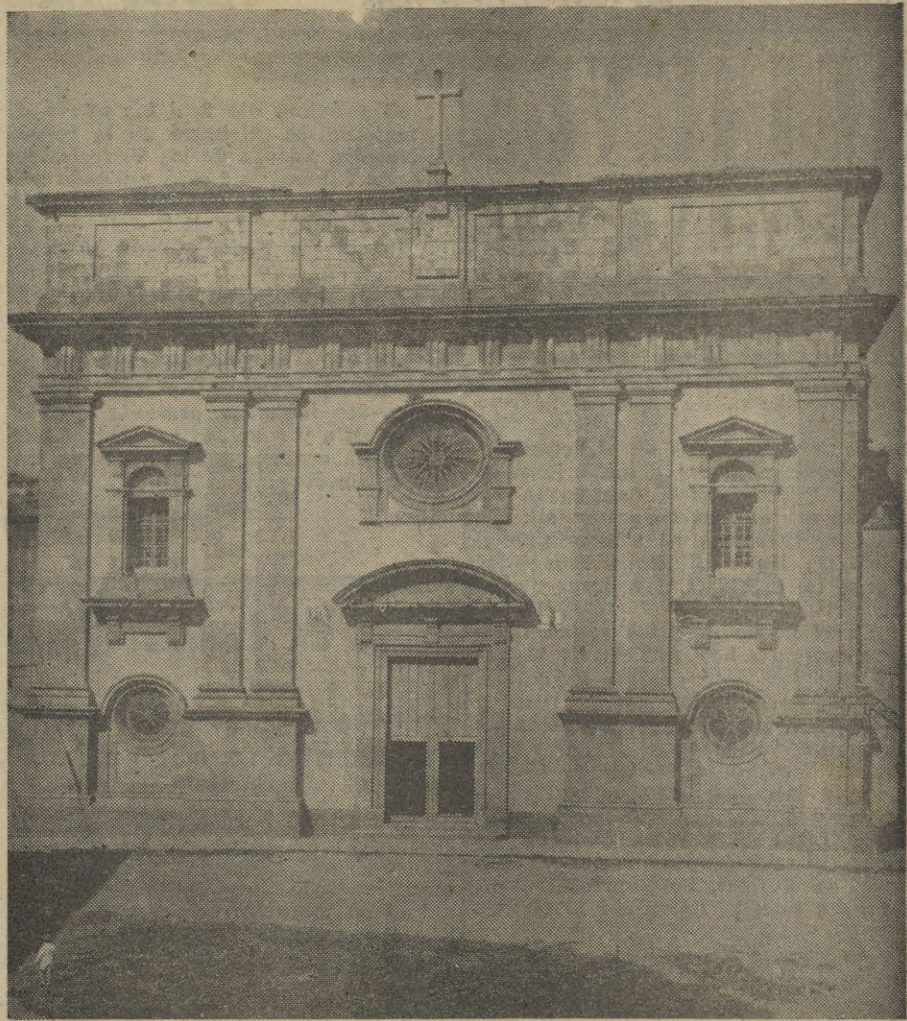
Aquí vemos la iglesia castreña de San Francisco, en la que el 17 de Diciembre de 1892, recibía el Sacramento del bautismo, el niño que cuarenta años más tarde, había de escribir la página de mayor gloria para su Patria.