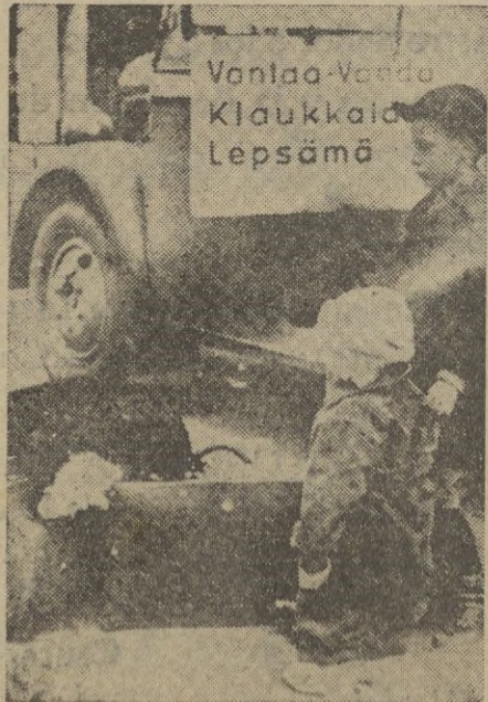
La invasión rusa lo impone. Los niños son alejados de las poblaciones para ponerlos a salvo de la agresión soviética.

Cuatro de estos aparatos han sido abatidos por las defensas antiaéreas finlandesas.