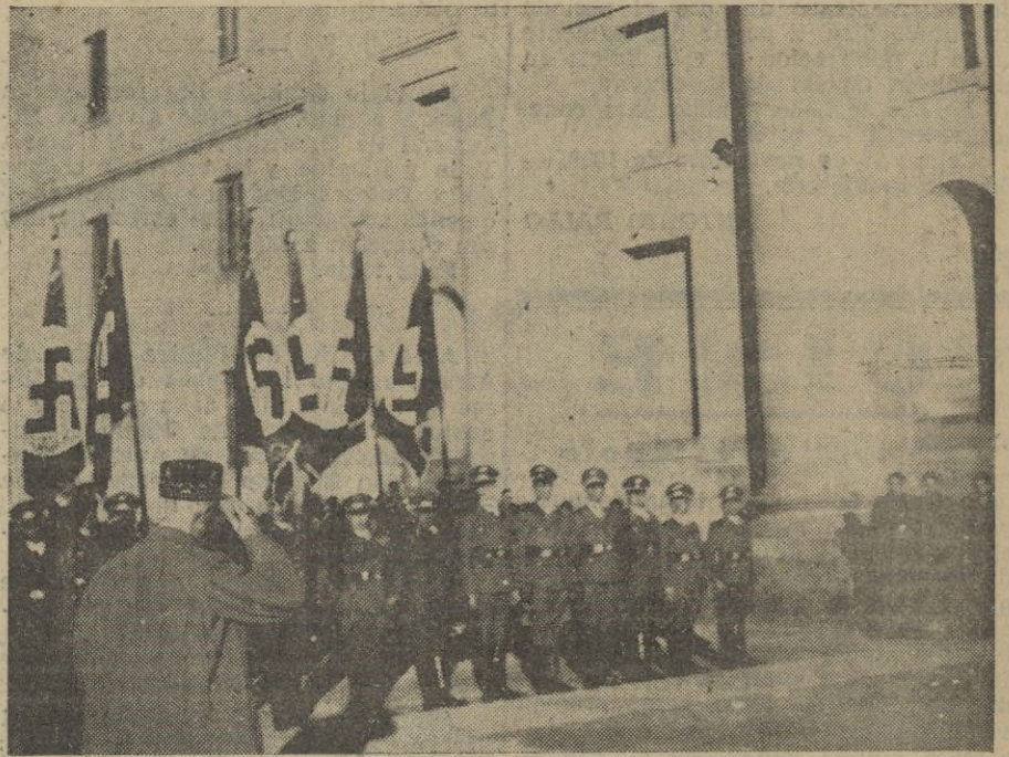
La representación alemana, a la entrada del Monasterio rinde honores a la llegada del Embajador de Francia, Mariscal Petain, que corresponde saludando militarmente.

Se dice que Daladier, convencido de la importancia de la oposición, tratará de ampliar el Gobierno hacia la derecha, ya que, a consecuencia de las declaraciones hechas por Blum, en la Cámara parece posible una participación de los socialistas en el Gabinete. (Radio Nacional).