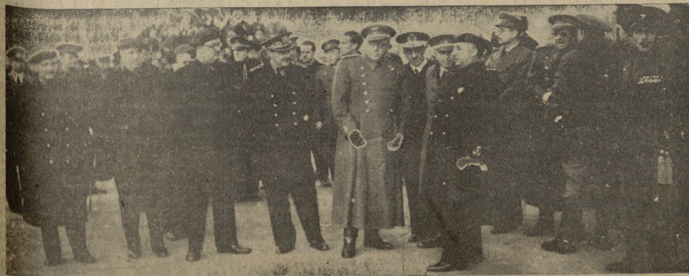
El Escorial. -- El Generalísimo Franco, con los Ministros de su Gobierno, espera a la puerta del Monasterio la llegada del cortejo, para hacerse cargo de los restos de José Antonio.

(Amplia información en las páginas 4 y 5).