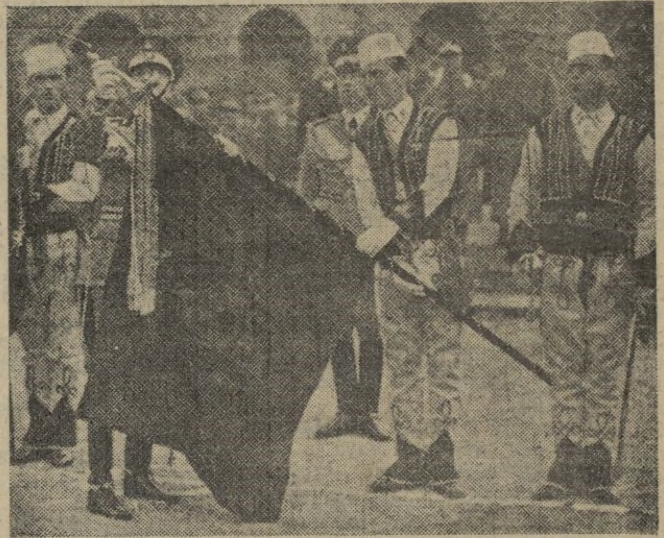
Recientemente tropas expedicionarias albanesas, visitaron Roma donde, con la máxima brillantez se les hizo entrega solemne de una nueva bandera