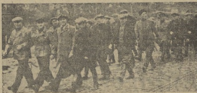
Todos los hombres útiles de Finlandia acuden a la defensa del país ultrajado. Como esta fila se ven muchas llegando continuamente a los acuartelamientos

por los soviets según la cual las tropas rojas, habían conseguido romper la línea fortificada de Finlandia en el istmo de Carelia.