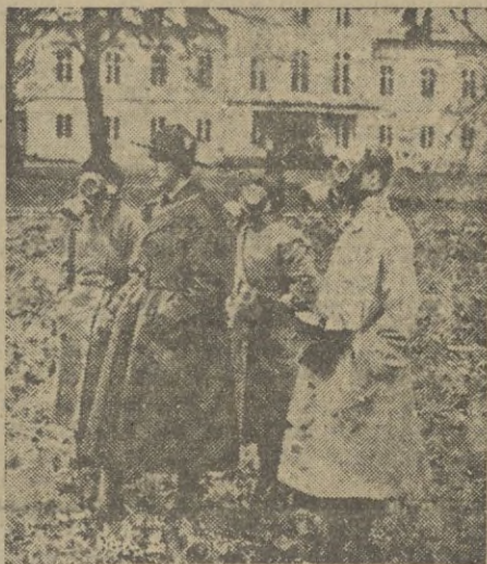
El hijo mayor del heredero de la corona sueca, príncipe Gustavo Adolfo, asiste en el castillo de Haga a un curso de defensa antiaérea. Durante el experimento, usaron la careta antigás.

Helsinki, 7. — Oficialmente se desmiente la noticia propalada