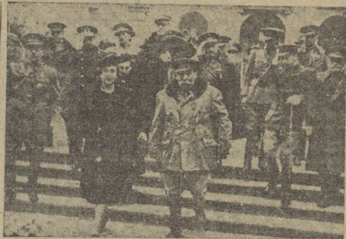
La esposa del Caudillo

¡Infantería española! Avanzada de nuestra civilización y espejo de héroes, de santos y de poetas. Y todo esto porque la Virgen Inmaculada intercede por los infantes españoles, que han sabido hacer siempre de su heroísmo, abnegación y disciplina, oraciones sentidas y vividas, lanzadas al cielo en súplica de maternal intercesión.