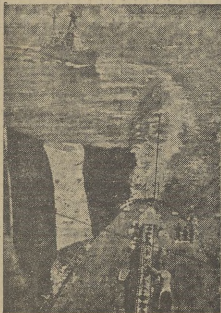
Barcos de la escuadra francesa actuando en servicio de vigilancia por zona mediterránea.