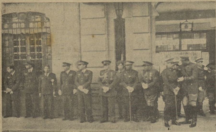
S. E. el Alto Comisario en unión de las autoridades y representaciones de otras armas presenciando el desfile de las fuerzas, después de la misa en honor de la excelsa Patrona de la Infantería.