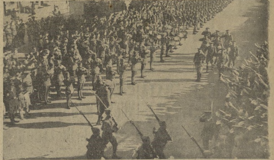
Los generales jefes de las fuerzas militares de Marruecos y del Noveno Cuerpo de Ejército, revistando las fuerzas.