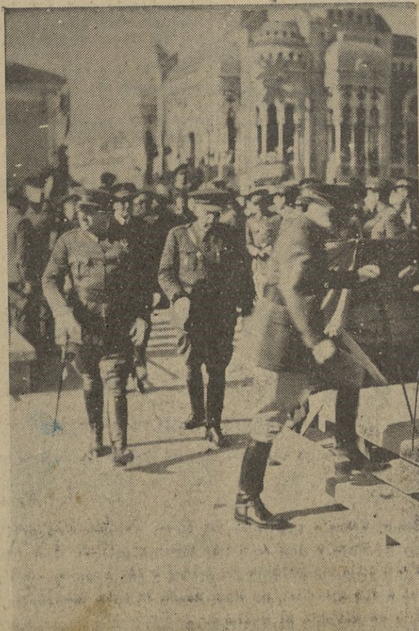
Las jerarquías militares se encaminan a la tribuna situada en la Plaza del Capitán Ramos para presenciar el paso de la Infantería