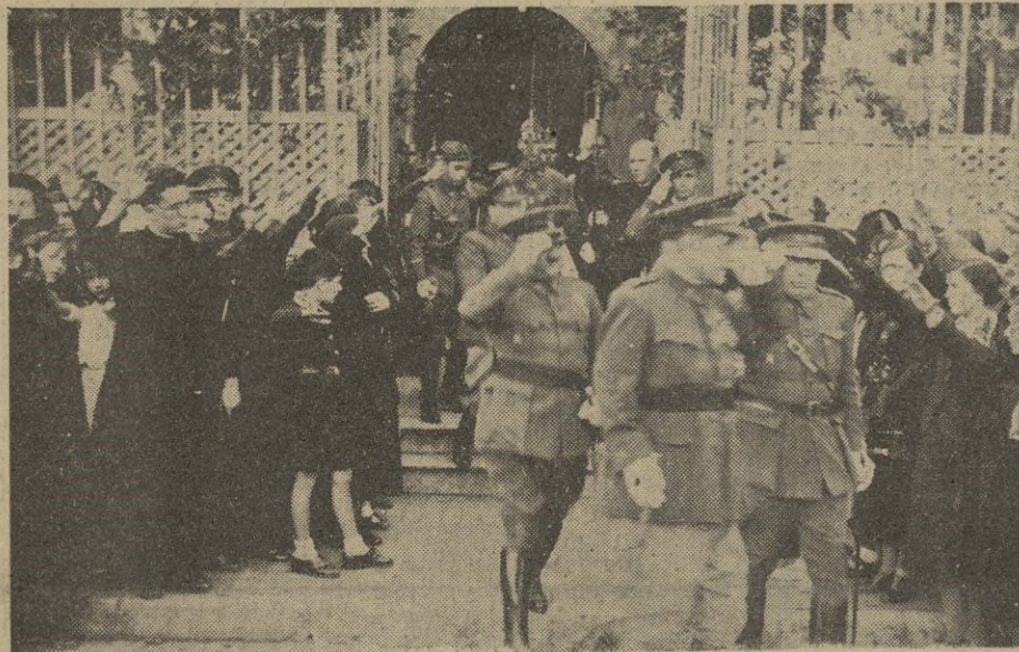
La autoridades militares a la salida de la Iglesia de San Francisco son saludadas por el público brazo en alto.