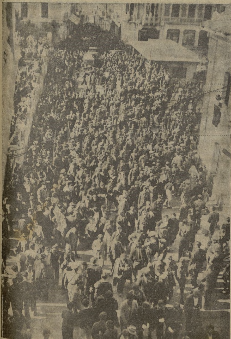
Después del desfile el público muda de calle, pleno de júbilo en esta jornada solemnisima de la Inmaculada Concepción, Patrona de los Infantes de España.

AMPLIA INFORMACION DE LOS SOLEMNES ACTOS, CELEBRADOS AYER EN NUESTRA CIUDAD, EN HONOR DE LA PURISIMA CONCEPCION, PATRONA DE ESPAÑA Y DEL ARMA DE INF.ª EN PAG. 4.ª