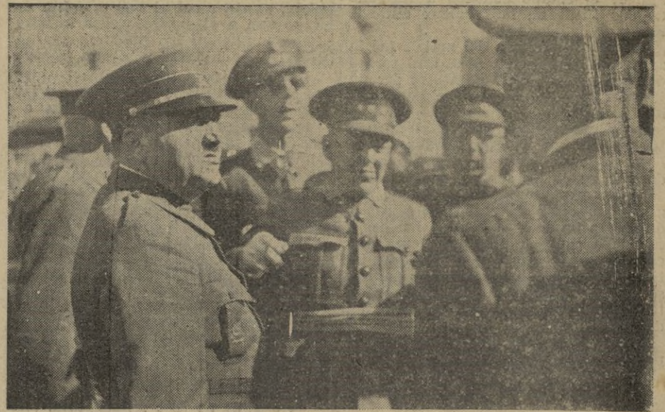
Terminado el brillante desfile, los Jefes de Cuerpos, se despiden de las más altas Jerarquías del Ejército.

Y de nuevo esta voz se alza para que sirva de norma en esa nueva tragedia que ha provocado el mayor enemigo de la Humanidad: los dirigentes asesinos, autores de la destrucción del mundo, que proyectan sus maniobras criminales desde el Kremlin.