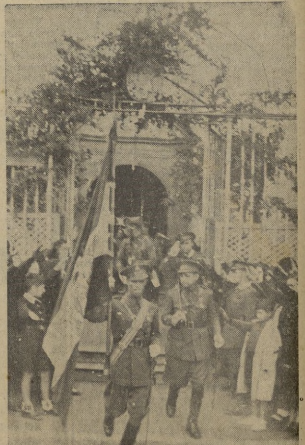
Las fuerzas de Infantería al salir del templo, tras la gloriosa enseña nacional, se encaminan a dar comienzo al desfile.