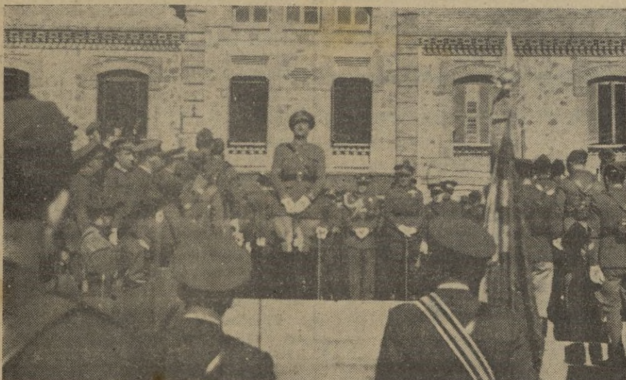
El Jefe de la División y comandante militar de la plaza, dirigiendo su magnífica arenga a las fuerzas de Infantería. (Fotos: García Cortés).