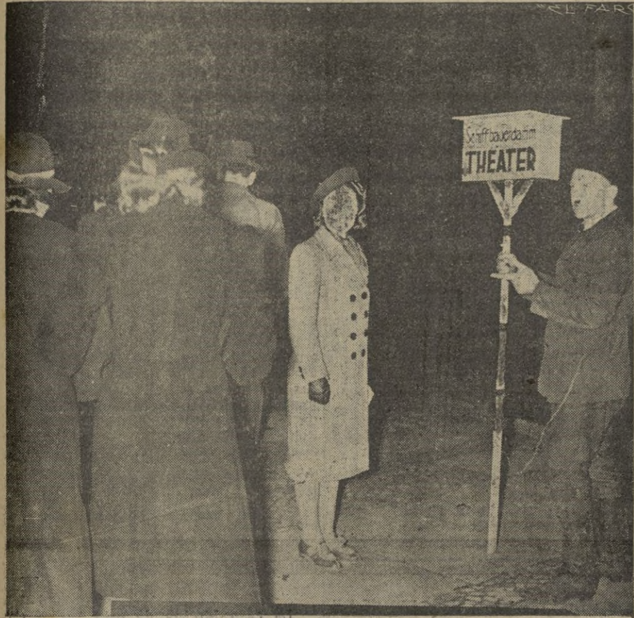
A pesar del oscurecimiento sigue la animada vida de los teatros. Un pitoto del teatro "Schiffbau rdam" en Berlín.