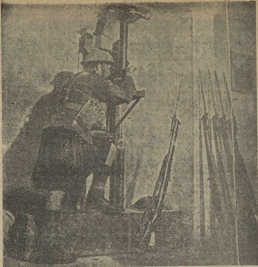
EN LA LINEA MAGINOT. -- Desde su garita subterránea, este soldado escocés vigila el campo enemigo por medio de un periscopio.