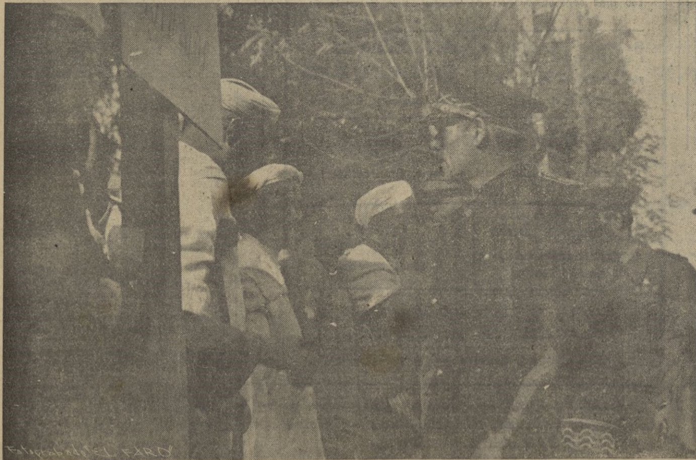
S. E. EL ALTO COMISARIO, GENERAL ASENSIO, SALUDANDO A LOS MUTILADOS, CON OCASION DE SU VISITA A ALCAZARQUIVIR