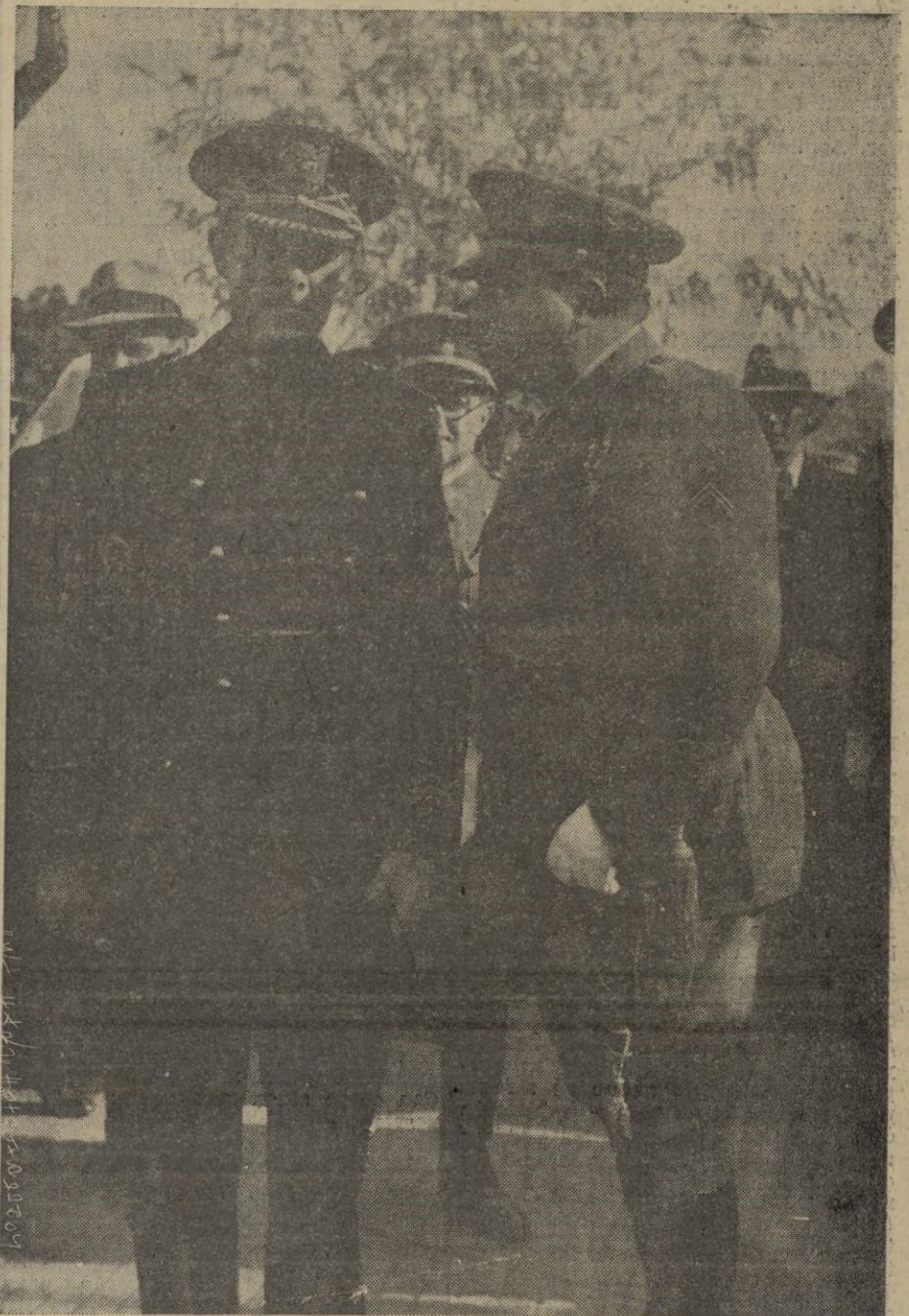
El Alto Comisario General Asensio y el General D. Juan Bautista Sánchez en Alcazarquivir. (Véase amplia información en las páginas 4 y 5)

¿TIENES HOGAR? CELEBRA LA NAVIDAD CRISTIANAMENTE EN EL TU-YO Y ACUERDATE DE LOS QUE NO LO TIENEN.