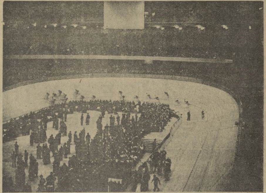
Campeonato mundial ciclista de aficionados en el pabellón Deriberland Halle, en Dublin.

Oslo, 15. — Los diarios de esta capital anuncian, que se han oído de cincuenta a sesenta explosiones semejantes a disparos de cañón, en la costa Sudeste de Noruega, cerca del sitio donde tuvo lugar, durante la última guerra, la batalla de Jutlandia. (Radio Nacional).