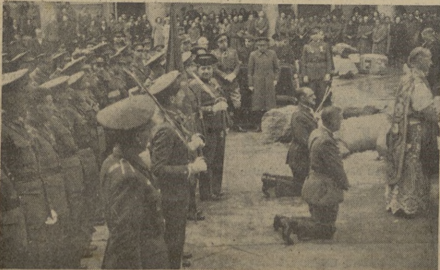
...o. -- Otro aspecto de la masa en el patio del Alcázar.