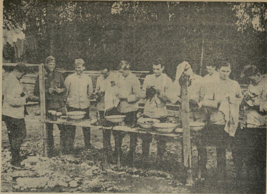
Los soldados alemanes aún en las posiciones más avanzadas cuidan perfectamente su higiene y la pulcritud de los cacharros y vajilla que emplean.

La Orden relativa al licenciamiento de los individuos pertenecientes al reemplazo de 1938, primer semestre, dice que dicho licenciamiento comenzará el día 25 del corriente mes, terminando el 30 del mes de enero, pudiendo ser licenciados los oficiales provisionales, que, perteneciendo al primer reemplazo de 1938, lo soliciten.