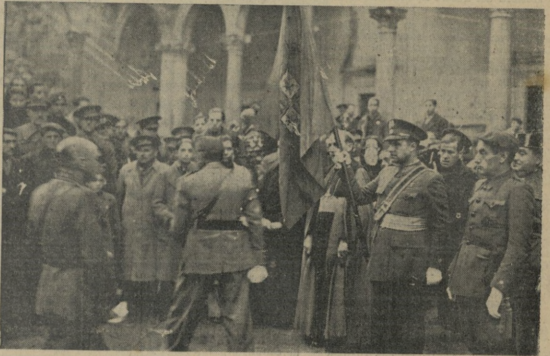
Toledo. -- Los cadetes de 1910, que en la actualidad son Jefes de las Distintas Armas del Ejército, vuelven a jurar la Bandera en el mismo lugar donde la juraron hace 25 años. Un aspecto de la ceremonia.