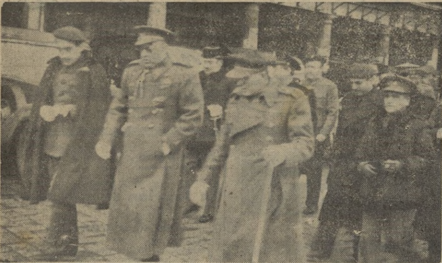
Toledo. -- Los Generales Moscardó, Muñoz Grande y Sáenz de Buruaga dirigiéndose al Alcázar, donde se celebró la Jura de la Bandera por los Cadetes de 1910.