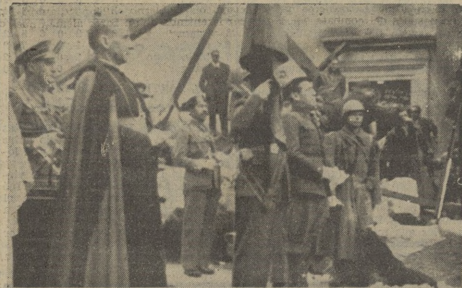
Toledo. -- El General Muñoz Grande actuando de Sargento Mayor les toma el juramento.

La Telefónica obsequió a las jerarquías superiores de la Prensa y acompañantes, con un vino de honor, en una de las salas de la planta novena de su edificio central, de la Avenida de José Antonio.