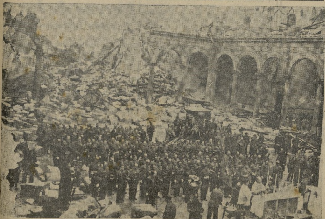
VISTA DE LA MISA QUE PRECEDIO A LA JURA DE LA BANDERA. (Amplia información gráfica en 4.ª página).

En el mar, fueron descubiertos varios contratorpederos, al cruzar el Golfo. (Pasa a la página quinta.)