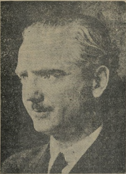
PRONUNCIA EN LA CLAUSURA DEL III CONGRESO DE