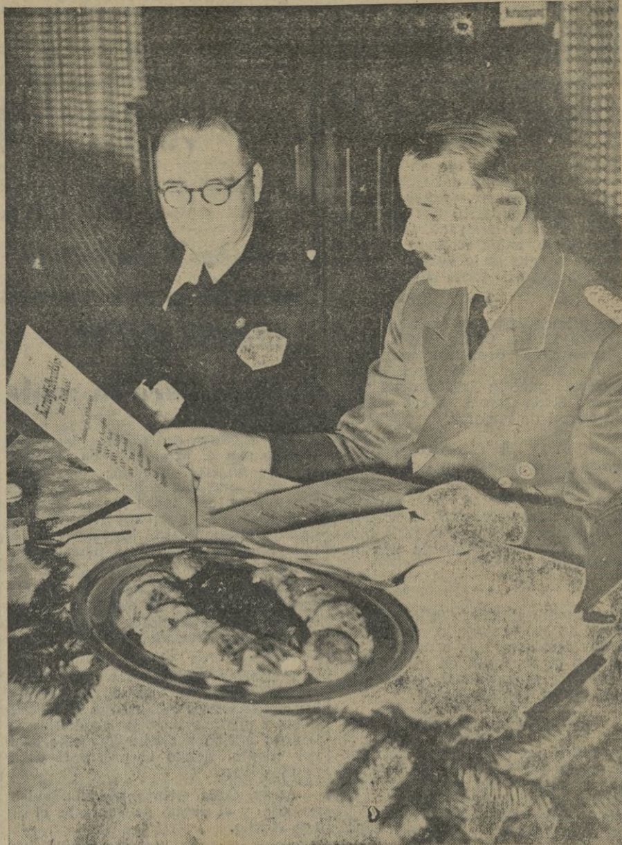
En el "Palacio del Turismo" de Berlín se ha instalado un restaurant modelo donde se sirven los platos típicos de las diversas provincias de Alemania. Nuestra foto muestra al Jefe Nacional del Turismo alemán, Secretario del Estado, Hermann Esser, durante el acto de inauguración.

El Soberano conversó con el presidente de la Federación Pesquera de Inglaterra y con otros representantes de la Asociación de Pescadores y hombres de las industrias marítimas, sobre los últimos acontecimientos de la guerra y en especial los últimos ataques de la aviación alemana contra los barcos mercantes y de pesca británicos. — (Radio Nacional).