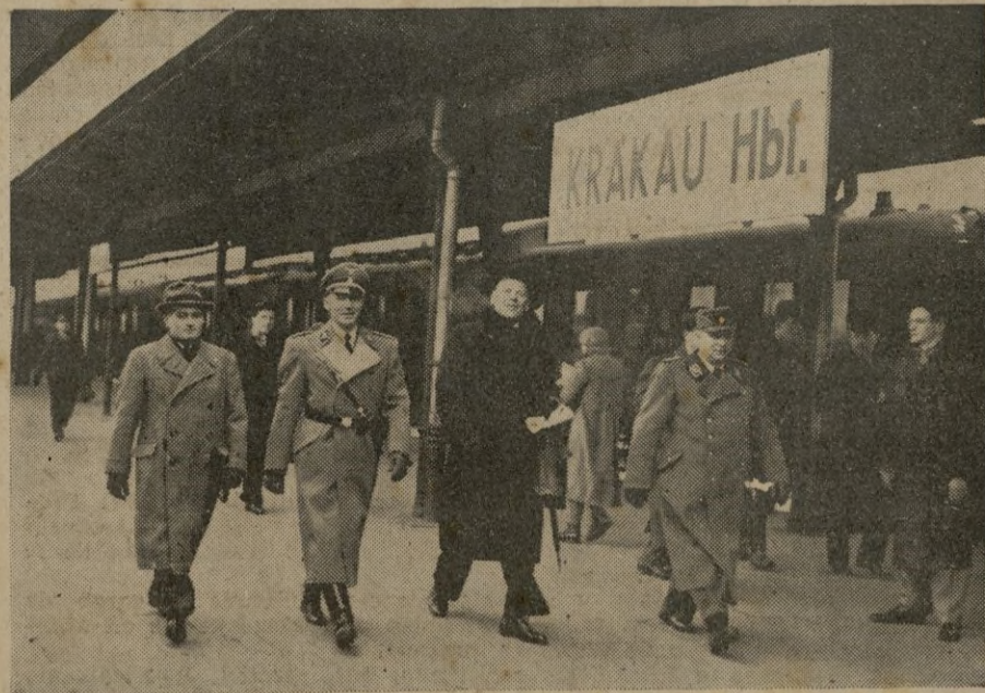
VIDA NORMAL EN POLONIA. -- La guerra terminada la vida sigue su curso normal en Polonia. Hace poco la orquesta filarmónica de Viena ha dado un gran concierto en Krakau, (Chacovia). La foto demuestra el director de dicha orquesta Profesor Dr. Hans Knapertsbusch al llegar a la estación.

Algunos barcos que estaban en ruta para Alemania han tenido que retirarse a puertos de invierno. — (Radio Nacional).