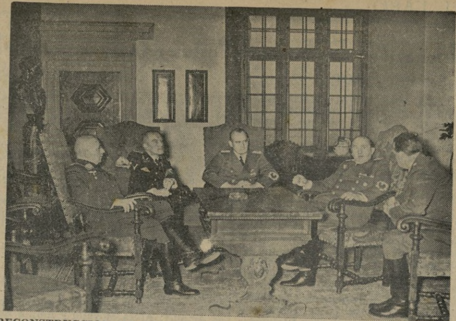
RECONSTRUCCION DE POLONIA.-- En el palacio de Cracovia se ha celebrado, hace unos días, una importante conferencia a la que asistieron el ministro de Economía del Reich Dr. Funk, para resolver los problemas económicos de la Antigua Polonia.

Roma, 29. -- Los instrumentos de la estación sismográfica de Tarento, han registrado fuertes temblores de tierra, cuyo epicentro se encuentra a unos dos mil kilómetros al Este de Italia. -- (Radio Nacional).