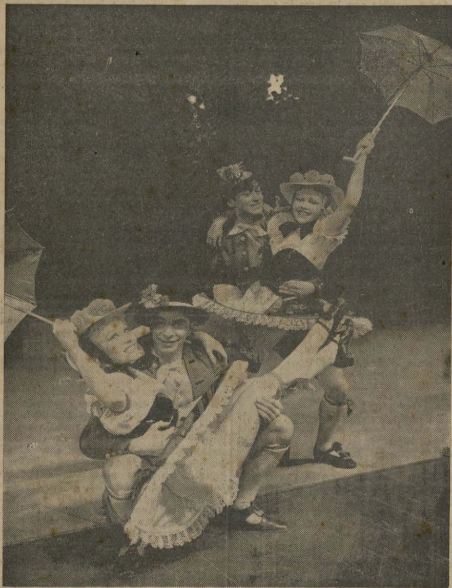
Escena de la presentación de "La muñeca mágica" en la Opera Nacional de Berlín.

París, 29. — El Senado ha comenzado esta tarde la discusión del presupuesto votado por la Cámara para la concesión de créditos para las necesidades de la defensa nacional. — (Radio Nacional).