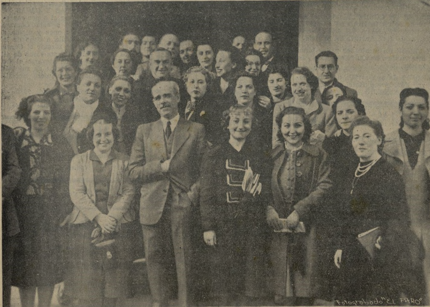
LOS ALUMNOS DE ARABE DE LA UNIVERSIDAD CENTRAL, EN LA ALTA COMISARIA. -- Terminada la visita posan ante nuestro objetivo con S. E. e l General Asensio y el Secretario general de la Alta Comisaria señor García Figueras.

Entre este número --añade-- no se incluyen otros tres cruceros que tienen también rango de buques capitanes. -- (Radio Nacional).