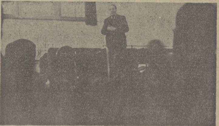
Nuestro director sube a la galería de la rotativa y da las gracias a los que nos honraron con su visita.