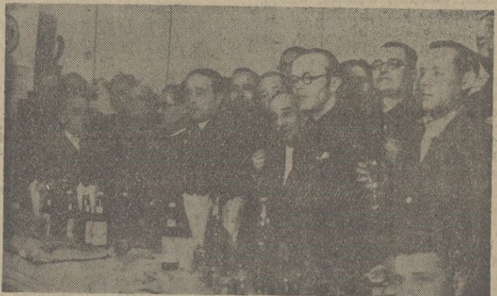
El ilustrísimo señor alcalde, rodeado del jefe local del Servicio Nacional de Prensa, del secretario de S. E. el Delegado del Gobierno Nacional y de los ayudantes de S. E. el General Jefe de las Fuerzas Militares de Marruecos.