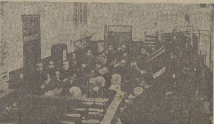
Grupo de visitantes se estaciona admirando el "inteligente" funcionamiento de las linotipias.