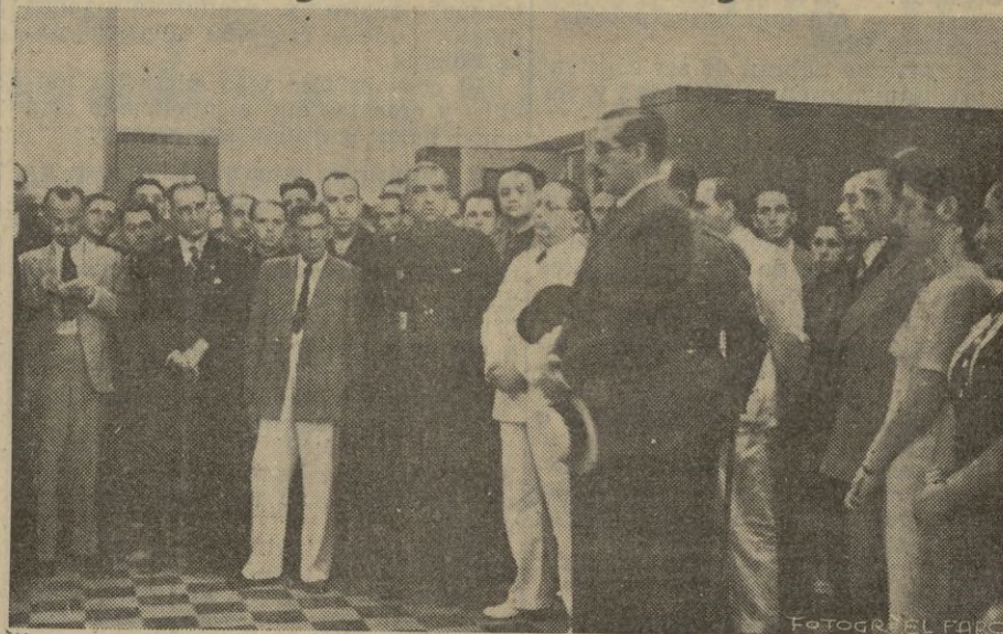
S. E. el Alto Comisario pronunciando su discurso del que dimos amplia información en nuestra edición de ayer. (Foto García).