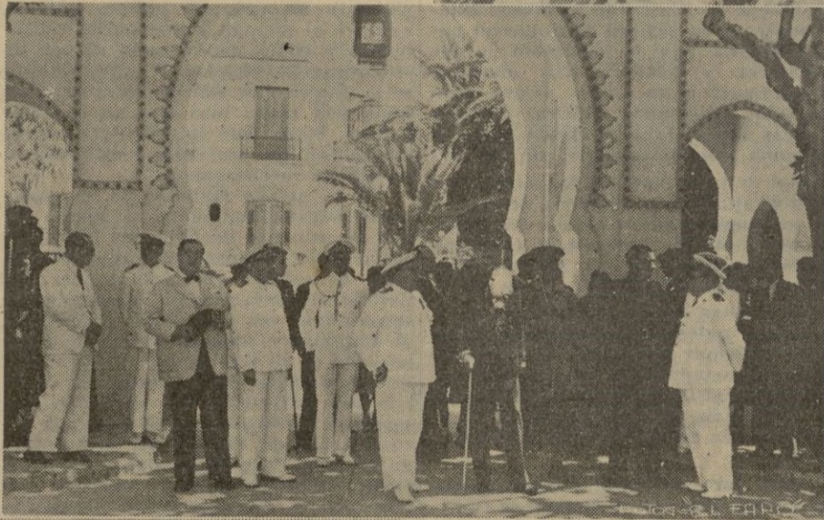
Detalle del desfile.

rante y a los Generales y altas autoridades antes mencionadas.