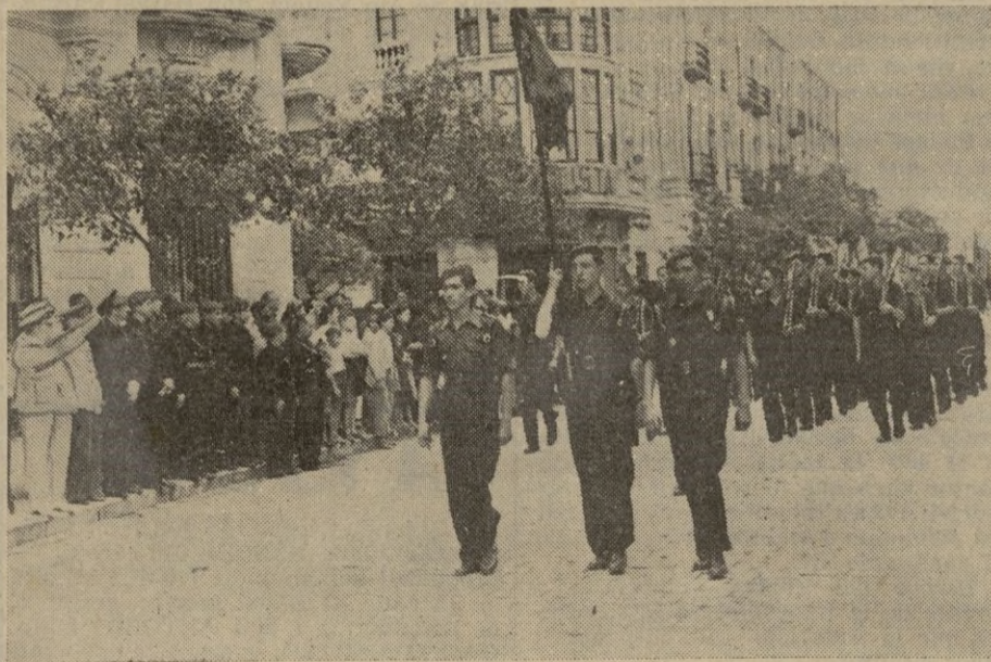
Desfile de cadetes.

La oración marinera fué escuchada con suma atención, pudiendo decirse que la interpretación, a pesar del número ingente de cantores, resultó magnífica. Dice así: