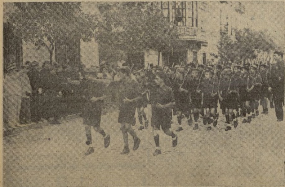
Los flechas y pelayos, desfilando ante la presidencia.