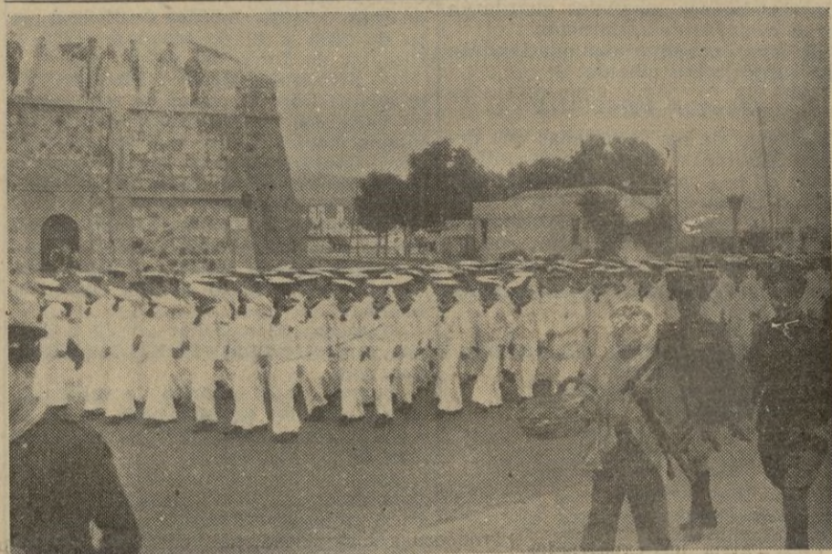
Los flechas navales a su paso por el Puente del Cristo.