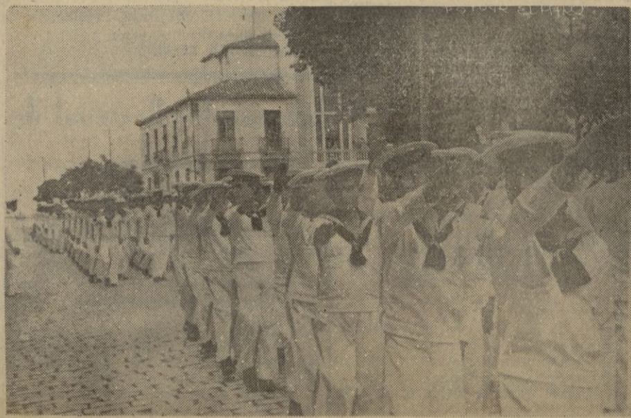
Los flechas navales, desfilando.