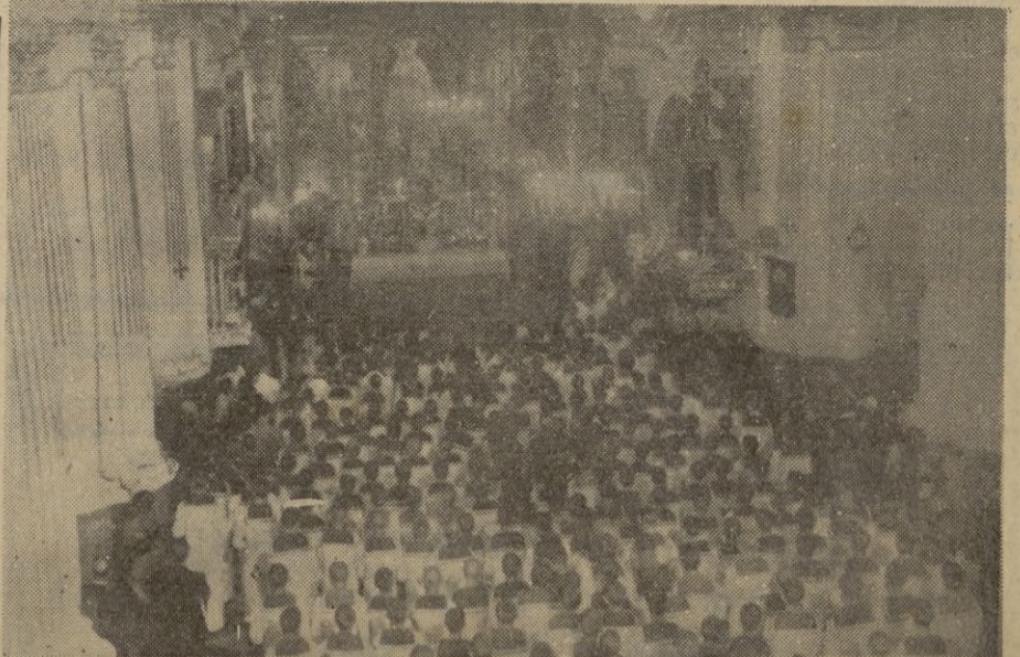
Aspecto que ofrecía el templo de Nuestra Señora la Virgen de Africa, durante el canto de la Salve y oración del marino.