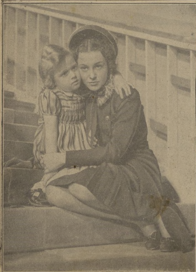
Ilse Werner y Mady Rahl en una escena del film "Señorita"

Pero aparte de todo esto, no se ha omitido perfilar bien los valores interiores del asunto, proporcionándonos una idea exacta y convincente de la dos personalidades opuestas y de la fé heroica en la idea infalible de la cien-