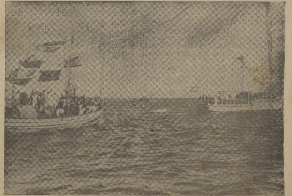
Bellísimo aspecto que ofrecía la procesión sobre las aguas. A nuestra derecha puede verse el yate "Benacantil", a bordo del cual iban las Autoridades. A poco trecho le sigue la embarcación en la que iba la imagen del Carmen.