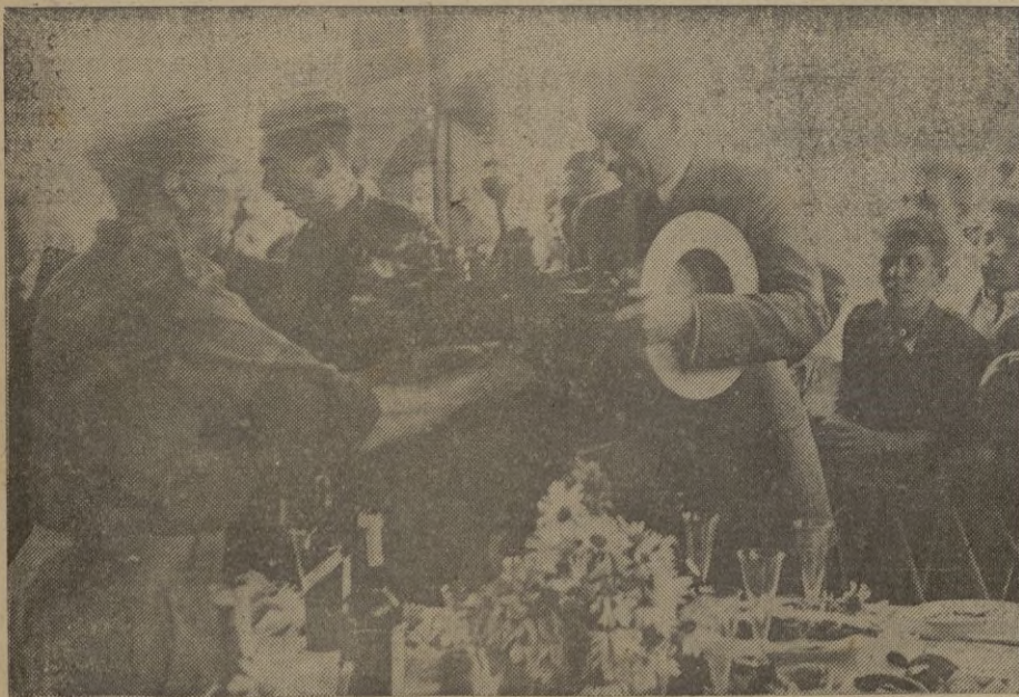
S. E. el Alto Comisario de España en Marruecos, don Juan Beigbeder Atienza, recibe en sus manos la hermosa maqueta de un buque de guerra, con que le obsequiaron los pescadores y vecinos de la Almadraba.

Los edificios de las calles céntricas permanecieron iluminados. Más tarde dió un concierto en la avenida de José Antonio, la Banda de música del Regimiento de Infantería de Tenerife.