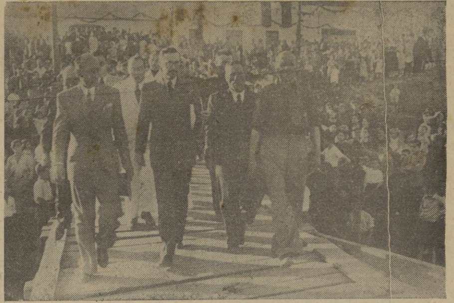
Los Excmos. Sres. Beigbeder y Guitart de Virto, dirigiéndose a la canoa que había de transportarles al yate "Benacantil", para presidir la procesión marítima.--(Foto Perea).

sular, Jerarquías de Falange, Jefes y Oficiales de los Cuerpos de la guarnición y otras muchas representaciones.