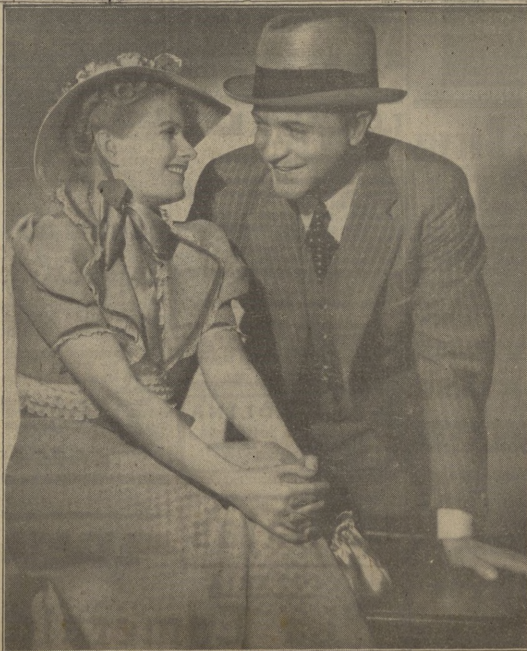
Viktoría von Ballasko y Willy Fritsch en el film Ufa "La Amante".

No obstante, se continúa trabajando a fin de reducir aún más los gastos de dicho automóvil.