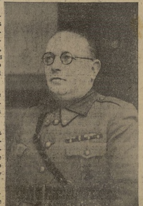
Excmo. Sr. Secretario General