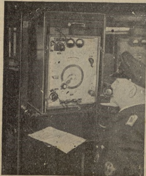
UNA ESTACION TELEFONICA DE ONDAS CORTAS EN FUNCIONAMIENTO A BORDO DE UNA FALUA POLICIACA