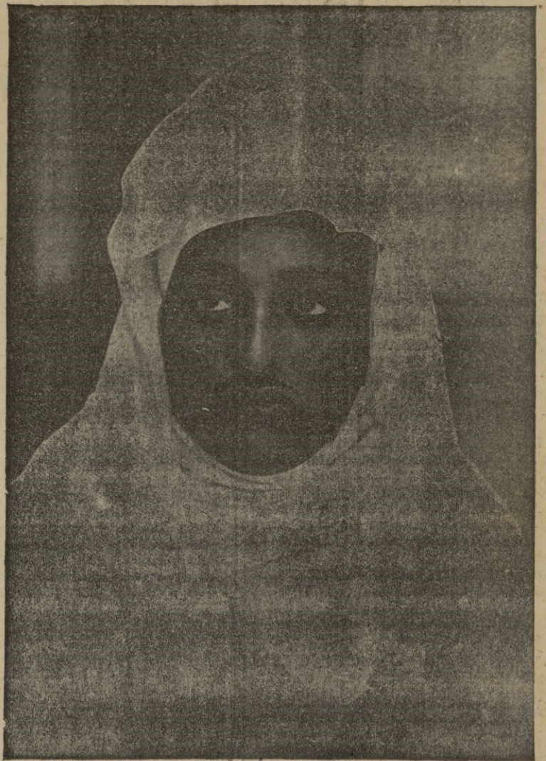
S. A. I. EL JALIFA DE LA ZONA