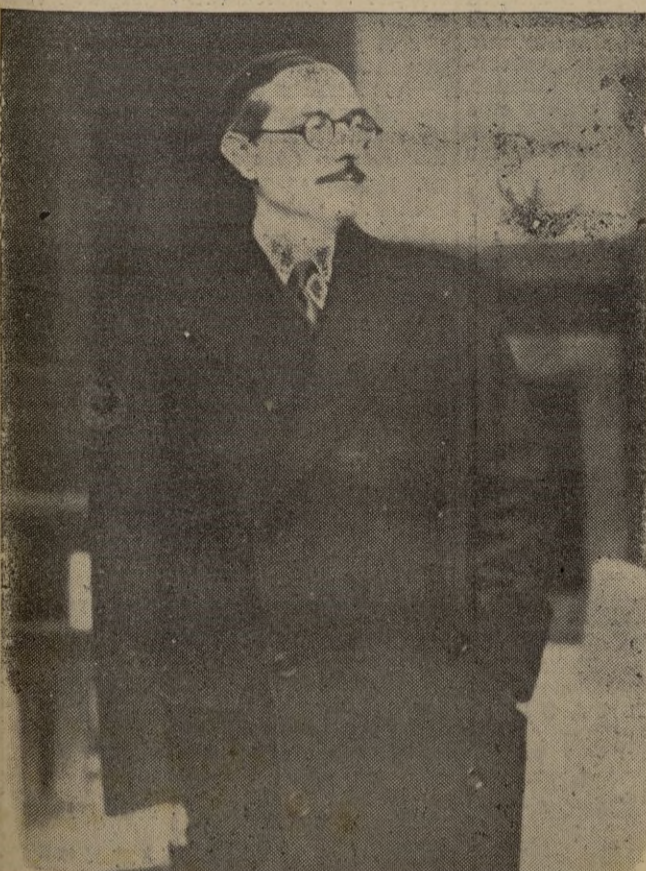
Excmo. Sr. Alto Comisario de España en Marruecos

Ya los rosales de la paz están floreciendo, y ellos, nuestros hermanos de Africa, seguirán recibiendo las más fragantes rosas.