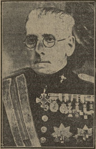
Excmo. Sr. General Jefe Superior

"Cuando florezcan los rosales de la Paz, las mejores rosas serán para Marruecos". - FRANCO.