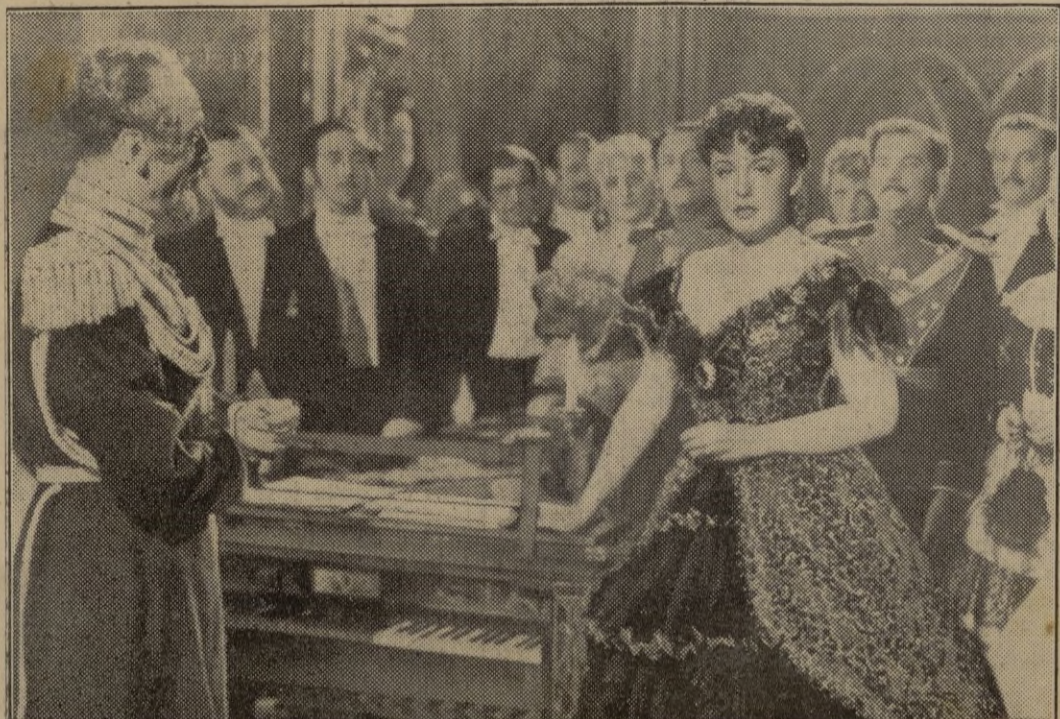
Zarah Leander, en una escena de su último film "En una noche de baile embriagador", basado en la vida del célebre compositor Tchaikowski