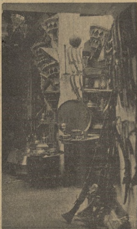
Al penetrar en este bazar donde los más variados objetos se presentan con singular armonía, observamos otras manifestaciones de la industria musulmana.