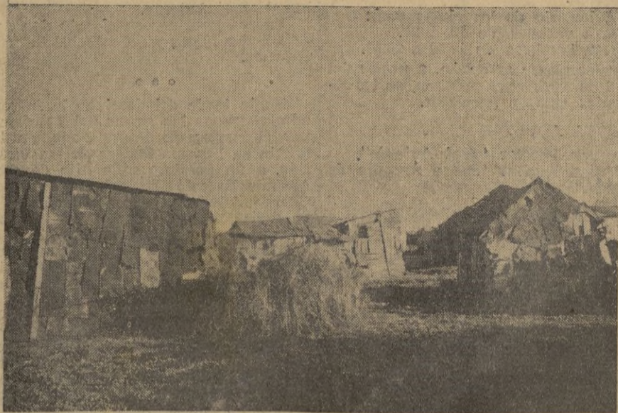
Al salir a los extrarradios, aire libre y buen sol, recogemos antiguas viviendas que la acción de España hace desaparecer para dar paso a...

Bellas historias tienen cada una de ellas. Nuestro paseo hace evocarnos aquellas y hoy, libres de trabas sin las bélicas formas para que fueron creadas, la ciudad, amplia y hermosa se adelanta tras sus recintos, así como desde el exterior parecen invitar a visitarlas y adentrarse en ellas. (Pasa a la página 5)