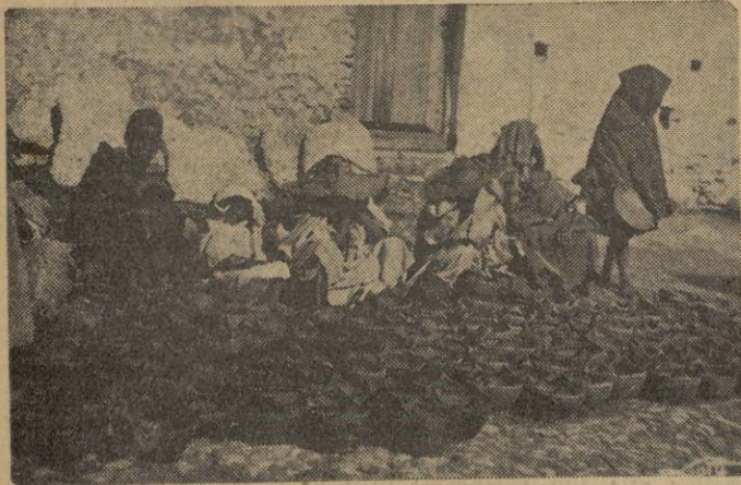
La industria del barrio, una de las más típicas y antiguas de Marruecos, cruza ante nuestra vista con estos puestos en pleno corazón del barrio moro.