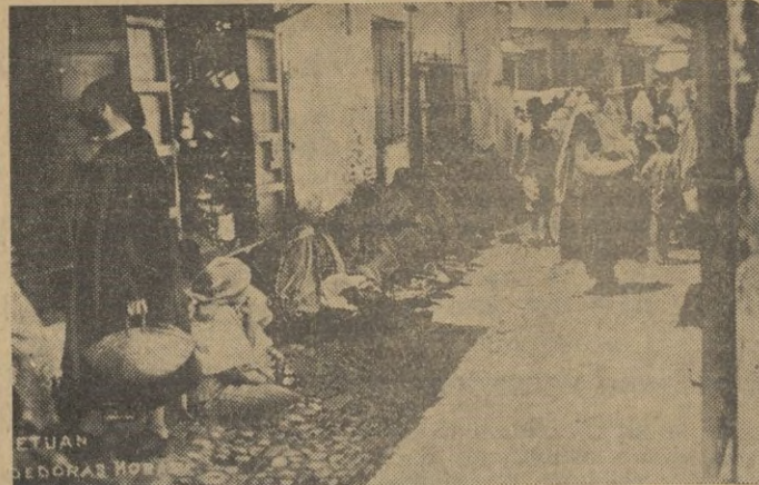
Los vendedores ambulantes de telas en sus largas horas de impasible actitud.

En Tetuán no existe propiamente dicho, separación absoluta en cuanto a razas se refiere, pues, como se sabe, la española se esparce por todos los barrios, la israelita además del suyo típico, habita gran parte del ensanche y la musulmana, aun cuando más recogida en la Medina, también vive alguna en las modernas barriadas sobre todo en las últimas edificaciones y que forman los extrarradios.