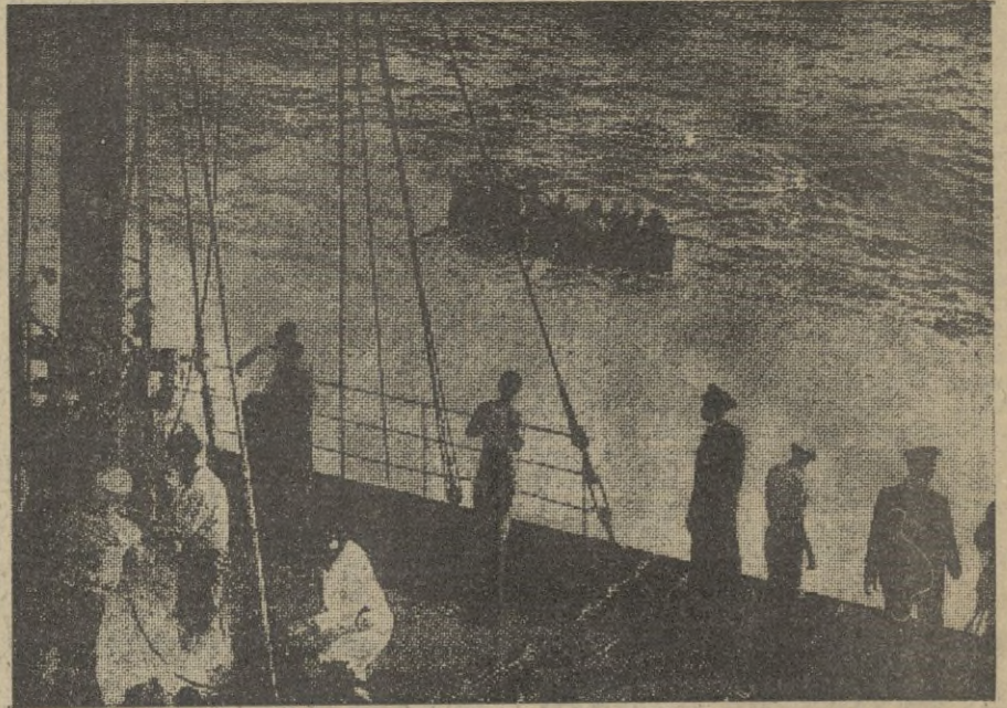
Apenas torpedeado un buque inglés, sus tripulantes fueron salvados por el barco neutral, en primer término, que rápidamente acudió en su auxilio.