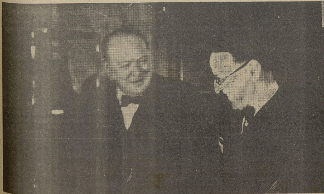
Winston Churchill, primer Lord del Almirantazgo y Mr. Campinchi, ministro de Marina francés que a lo que parece acaban de determinar en París, hace varios días, un plan para neutralizar la guerra submarina enemiga.