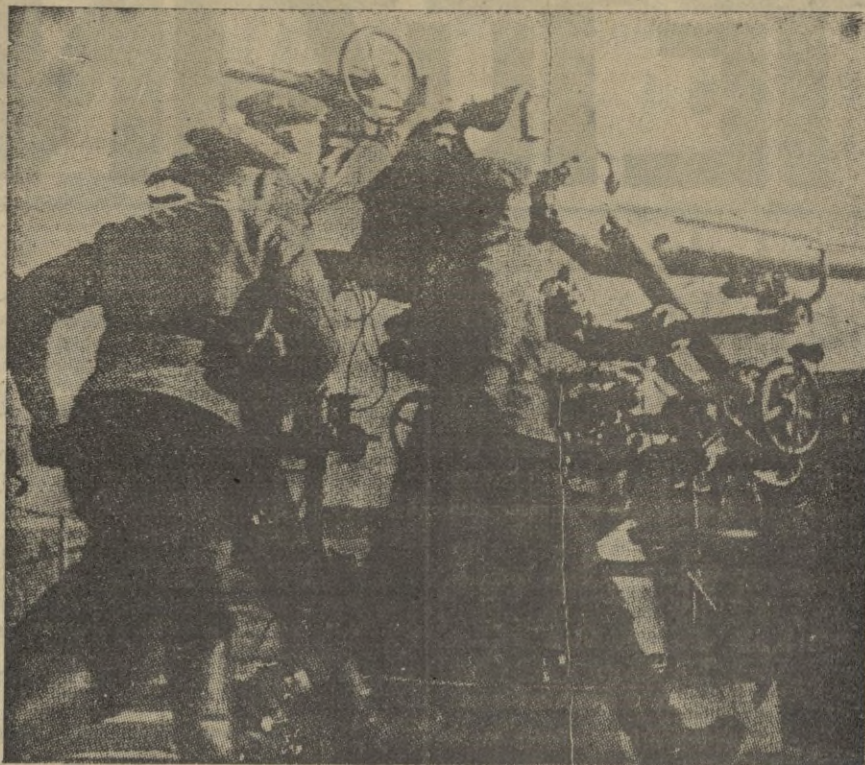
Servidores de una batería finlandesa durante una alarma aérea en los alrededores de Helsinki