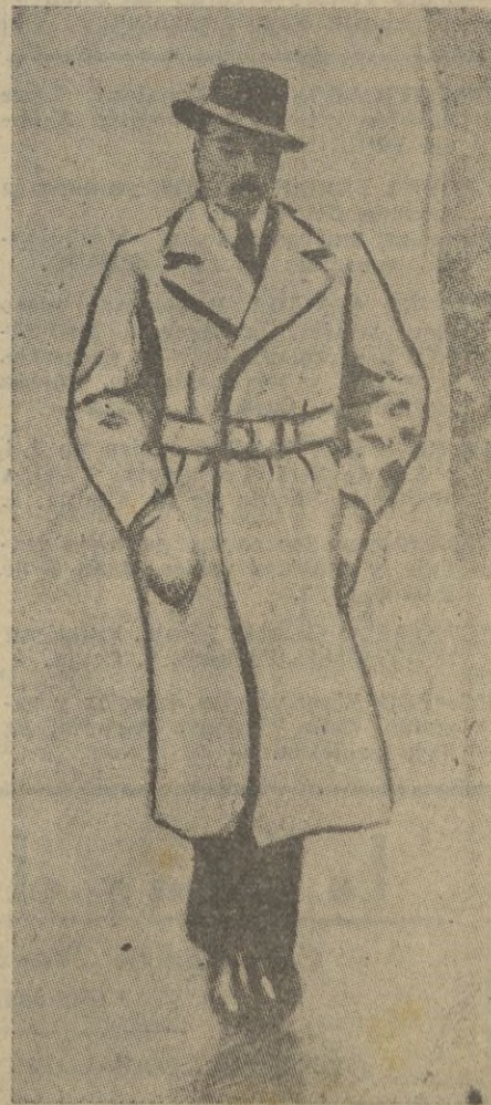
El conde de París, hijo del duque de Guisa, persona de mundial prestigio, que vive en Londres las horas dramáticas de la guerra.