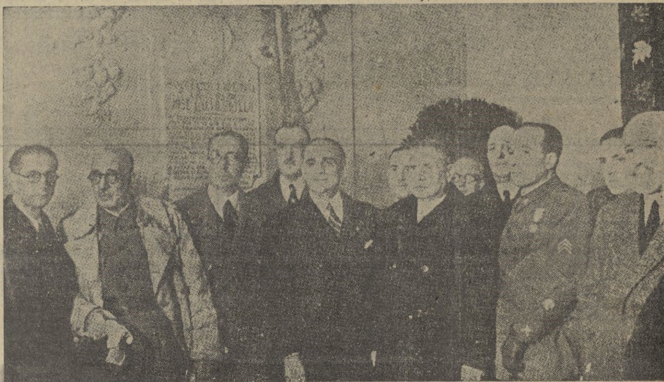
En el Banco Exterior de España se ha descubierto una lápida en que se perpetúa la memoria de su fundador, promartir don José Calvo Sotelo. Entre otras personalidades, concurre el actual gobernador de la entidad don Antonio Goicoechea.

Con motivo del traslado de los restos del glorioso fundador de la Falange se va a cubrir de antorchas la carrera por don de pasará el cortejo fúnebre. Es este un signo de religiosa solemnidad que nos recuerda un cuadro famoso del Greco, el "Entierro del Conde de Orgaz". Puede verse en él, en la parte baja, una severa línea de cabezas humanas, cabezas de hombres sabios y místicos, que rozan con las alfombras grises que forman las nubes del cielo, sobre las que se asienta el Poder de Dios. Y -- ¡sublime armonía de la verdad artística! -- los hombres que rodean el cadáver del Gran Señor de Orgaz alumbran la escena con largas antorchas.