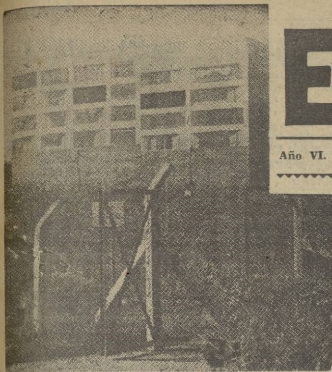
En las cercanías de la frontera alemana los holandeses poseen este gran abrigo de hormigón armado.