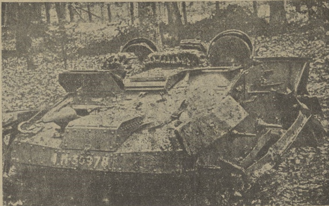
Carro blindado ligero del ejército francés destruido en la "tierra de nadie" por la artillería germana.

que el esfuerzo nacional está mal dirigido.