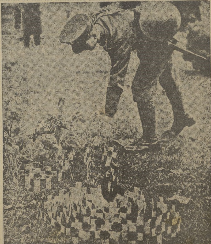
Es esto un curioso y emotivo modo de perpetuar la amistad: por la tumba del soldado inglés caído, la peregrinación de los que fueron compañeros, es constante. Y, cada uno va clavando en el lugar de reposo eterno, una pequeña crucecita con su nombre, gesto que dice mucho de la amistad que así marca la solidez de un afecto.

Milán, 24. — El Sindicato de Abogados de Milán ha dirigido un mensaje a la Junta del Colegio de Abogados de Madrid, en el que dice que se asocian de todo corazón a los honores rendidos a la memoria de José Antonio, que consagró su fe con su sangre, después de haber exaltado y defendido con su elocuencia de abogado en el Parlamento, en los tribunales y en las calles. — (Radio Nacional).