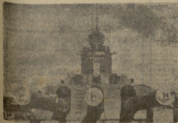
El acorazado "Nelson", uno de los más poderosos de la "Home Fleet", desplaza 35 mil toneladas y va armado con nueve cañones del 16, doce antiaéreos, treinta ametralladoras y dos tubos lanza torpedos. Su dotación es de 1.314 hombres y desarrolla una velocidad de 23 nudos.