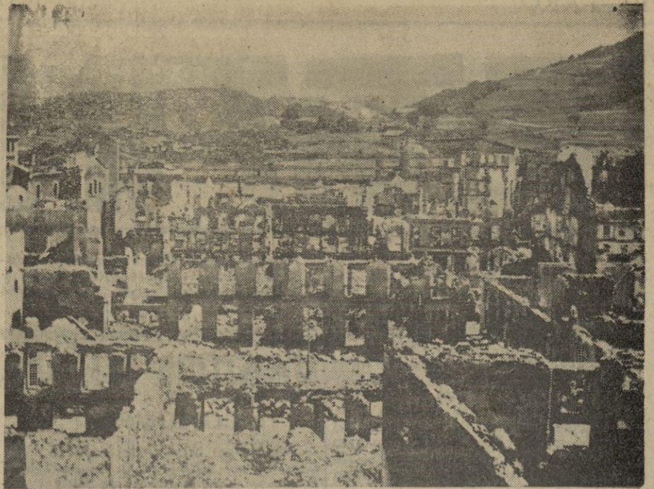
Guernica.—Una vista de la histórica ciudad, una de las que más sufrieron los efectos de la dominación marxista y que, adoptada por el Caudillo, comenzará en breve las obras de su reconstrucción.

El viernes en Cervantes, al mismo tiempo que en Madrid, el público de Ceuta aplaudirá la formidable película Nacional MARIA DE LA O