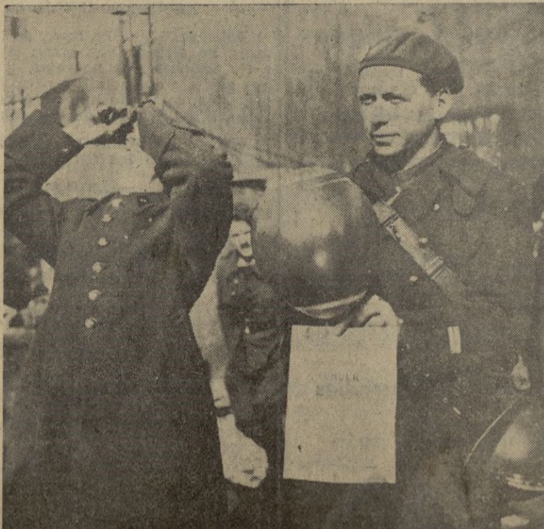
Uno de los globitos empleados por los alemanes para dejar caer en territorio francés folletos de propaganda del Reich.

París, 28. — Tendrá lugar un nuevo aumento del precio de los periódicos a consecuencia de la última subida del papel, que ha sido en un veinticinco por ciento. — (Radio Nacional)