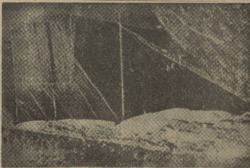
¿La barraca de un pescador con las redes puestas a secar? ¡No! Se trata nada menos que de un camouflagé de la línea Sigfrido.