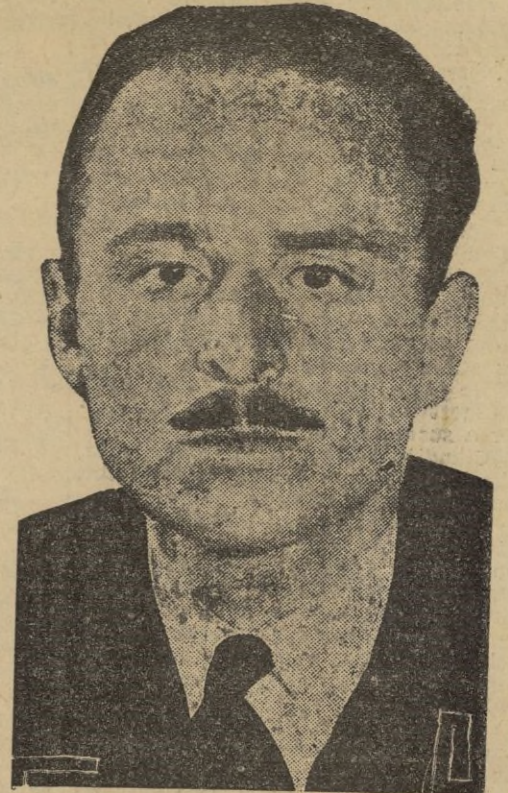
Madrid, 7. -- La Agencia Havas envía el siguiente comunicado:

Apenas iniciado el glorioso Alzamiento, empuñó las armas; pasando a desempeñar después la subsecretaría de Educación Nacional, en el primer Gobierno del Caudillo.