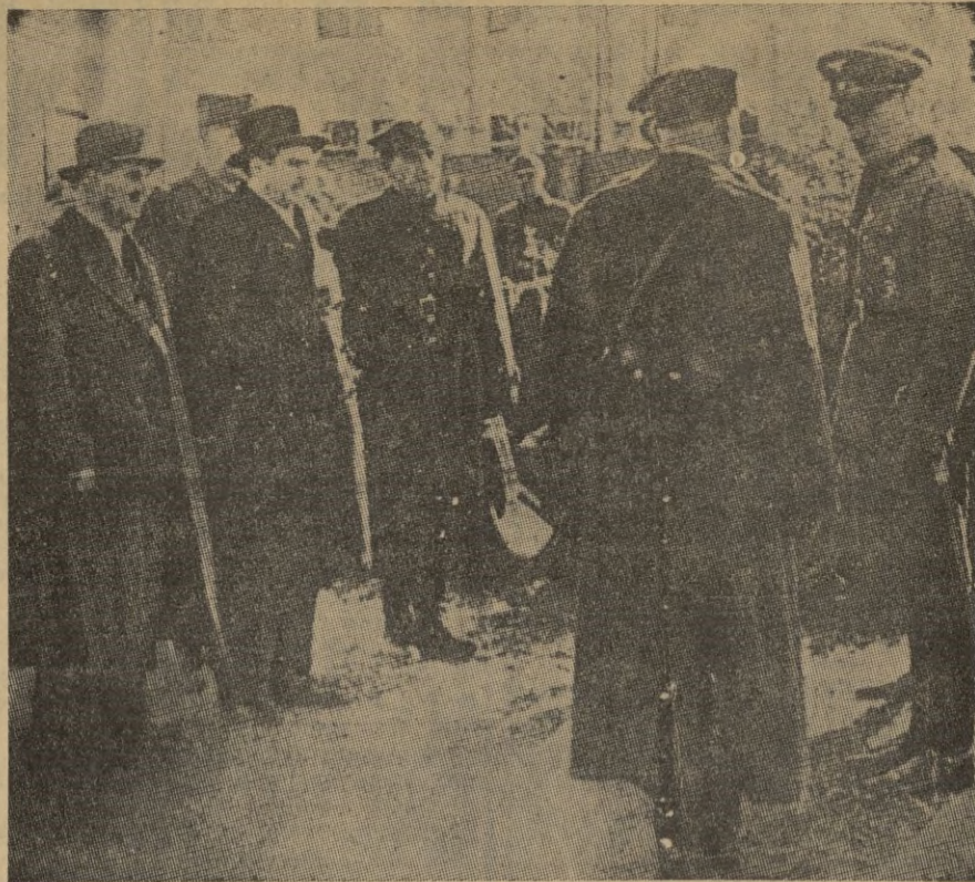
La foto recoge el momento en que los generales Blaskowitz y Kutrzewa parlamentan, para la rendición de Varsovia.