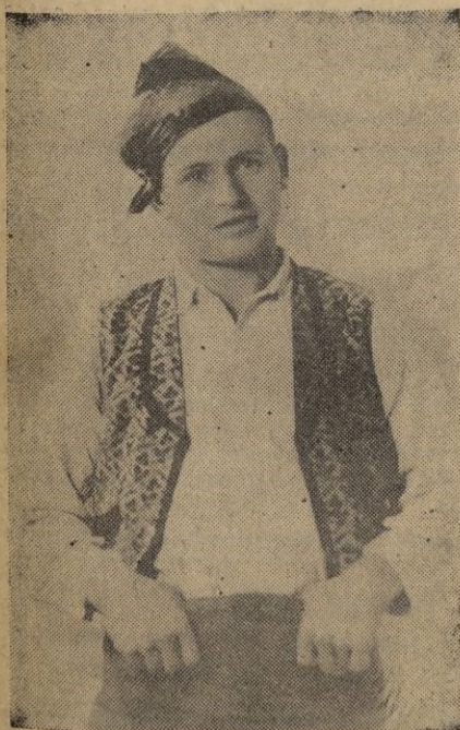
El notable cantador de jotas, que anoche actuó lucidamente en el "Cervantes", en brillante función organizada por la Colonia Aragonesa.

Zaragoza, 11. — Fermín Trueba ha triunfado en la sexta etapa de la Primera vuelta ciclista a Aragón, Egea de los Caballeros-Calatajud, sobre una distancia de 112 kilómetros.