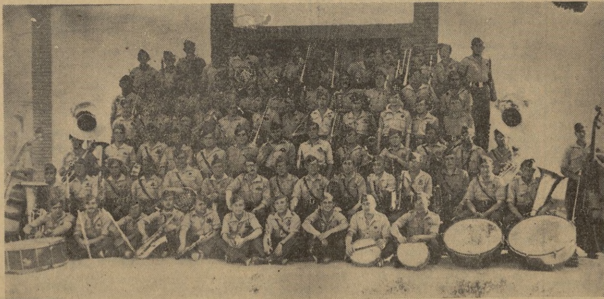
Los profesores de la notable Banda de la Legión que anoche, como anticipo de las fiestas en honor de la Santísima Virgen del Pilar, dieron un selecto concierto en la sala del "Cervantes", recordando una vez más por su lúcida actuación, muestras del más cálido homenaje.