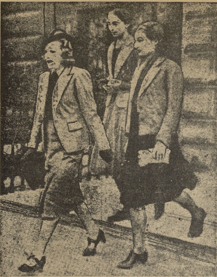
Las hijas del mariscal polaco Pilsudski, Wanda y Jadwiga, con la hija política del antiguo presidente Mosciki, al salir de su residencia en Londres.

Entre el vecindario causó extraordinaria satisfacción la piedad demostrada por la hija del Caudillo, ante la desgracia que aflige a una pobre mujer del pueblo.