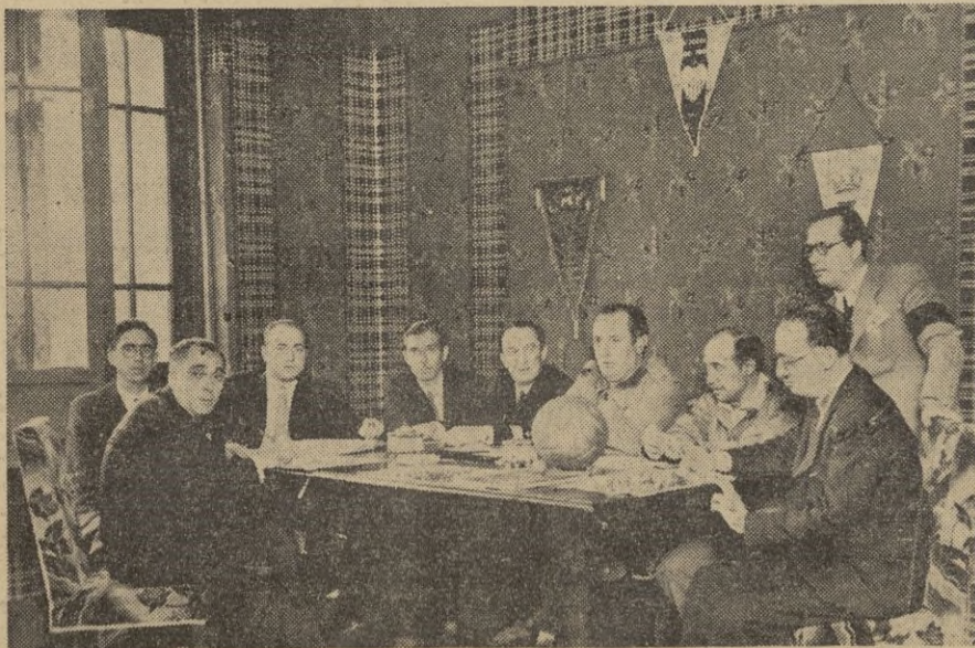
Se ha celebrado una interesante reunión a la que concurrieron los elementos más directamente ligados con el deporte, presididos por el activísimo presidente de la Federación Sr. Sánchez Urdazpal, para estudiar una más perfecta coordinación, que dé vida y un mayor auge al fútbol en las plazas de Soberanía y Zona de Protectorado.

Los tripulantes venían formados sobre cubierta, ocupando la torre de mando el comandante del submarino. El jefe de Marina dió la bienvenida a toda la tripulación, diciendo que toda Alemania se sentía orgullosa de este submarino. A esta felicitación contestó el comandante, dándole las gracias en nombre de sus subordinados.