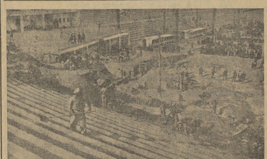
La febrilidad estos días en el Stadium Metropolitano, donde tendrá lugar la concentración de Organizaciones Juveniles el día 29, como puede verse, es inusitada, y las brigadas de obreros se multiplican en la tarea que tanto realce le dará.

La despedida fué muy cariñosa y se realizó, dentro de la mayor sencillez.