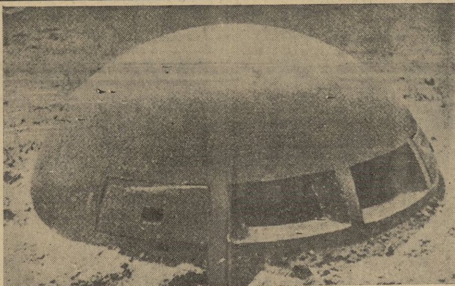
Dos líneas a cual más formidables. De un lado, a la izquierda la cúpula acorazada de un puesto de observación de la Sigfrido (alemana); y de otro, a la derecha, una torre de acero, defensiva, de la Maginot, (francesa).