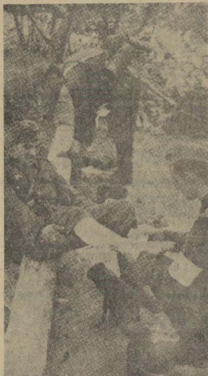
Tan continuadas han sido las marchas de los soldados alemanes -- casi de 60 kilómetros diarios -- que frecuentemente tienen que buscar alivio a sus pies heridos.

Para terminar, dijo el diplomático Jahner, he de decir que la anulación del embargo de armas supondría una ayuda eficaz a Inglaterra, lo cual sería faltar a la neutralidad. Conocemos bien el mal resultado de la política de Wilson, porque a los Estados Unidos están sufriendo as duras pruebas económicas a que se nos sometió entonces con la intromisión de Norteamérica en la guerra mundial.