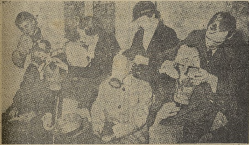
La "moda" de las caretas, que "no tiene" refractarios, encuentran su mejor centro en París, donde la gente se adapta fácilmente, como puede verse por este documento gráfico.