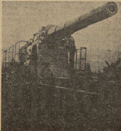
Pieza artillera de calibre 345 etms. de las que utiliza Alemania en la actual guerra. Con plataforma y soporte pesa treinta toneladas.