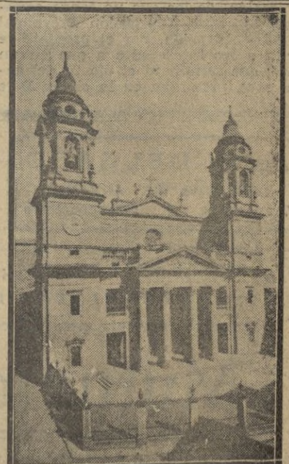
La Catedral de la capital de Navarra, donde ha tenido lugar ayer solemne acto religioso, oficiado por el Obispo de la Diócesis, en sufragio del alma del glorioso general Sanjurjo.