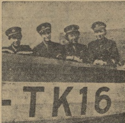
Este grupo de chicas, entre las que figura la hija adoptiva de Kemal Ataturk, ha visitado Inglaterra, pilotando una escuadrilla de aviones turcos.