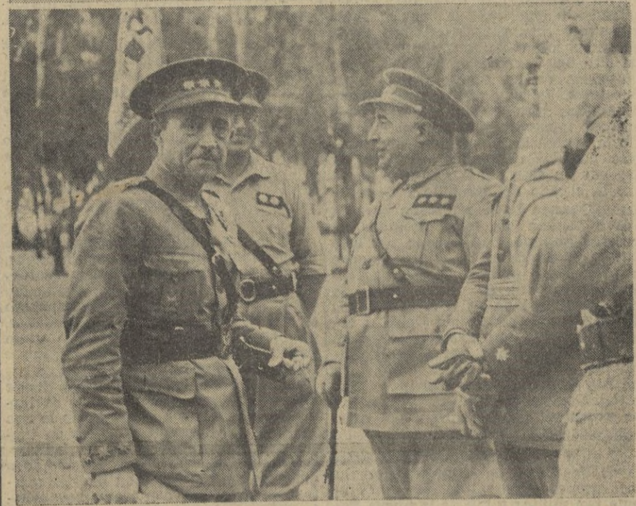
Larache.--El Jefe del Territorio presenciando con el nuevo Jefe del Grupo de Regulares de Larache, el desfile de las fuerzas.