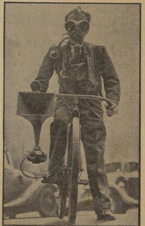
En la última alarma aérea en Londres, toda la población se mostró bien preparada en sus medidas de defensa. La foto recoge a un "ciclista", provisto de careta anti-gás.

Amsterdam, 14. — Los periódicos informan que los puertos se hallan atestados de barcos pesqueros y que miles de pescadores holandeses se encuentran sin trabajo, ya que no pueden salir al mar por el peligro que representan las minas submarinas.