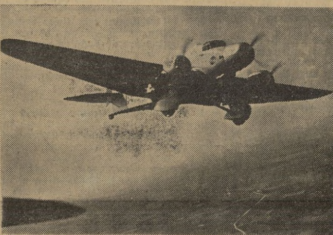
Son las alas de acero, en el teatro de la guerra, elementos cuya acción es muy eficaz. El ruido de los motores en Londres, París, Varsovia... provoca la natural alarma, precursora de sustos y emociones.

Muy pronto estos animales estarán en granjas de la Alta Silesia.