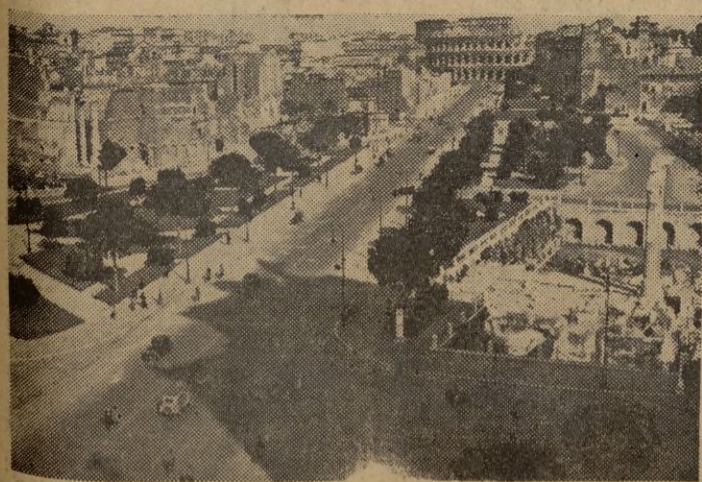
He aquí la Vía del Imperio de Roma: Camino de victoria, por donde las bravas legiones del Duce supieron y saben mantenerse fieles a su doctrina, con su fe y confianza en la sabia dirección de Mussolini.

Bucarest, 16. — El Cardenal Arzobispo de Varsovia ha llegado a Bucarest ayer. Se cree que continuará su viaje a Roma, donde será recibido por Su Santidad el Papa.