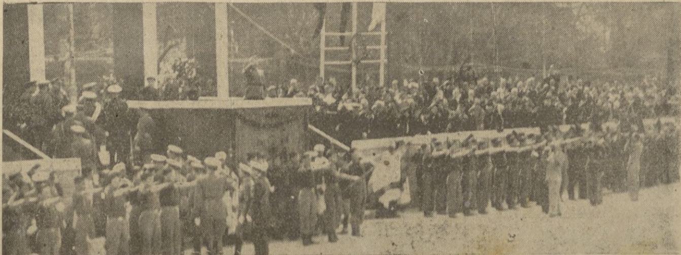
El Generalísimo Franco, desde su tribuna, corresponde a las aclamaciones de la multitud, en el desfile del pasado lunes.

Número premiado en el sorteo de ayer el 112.