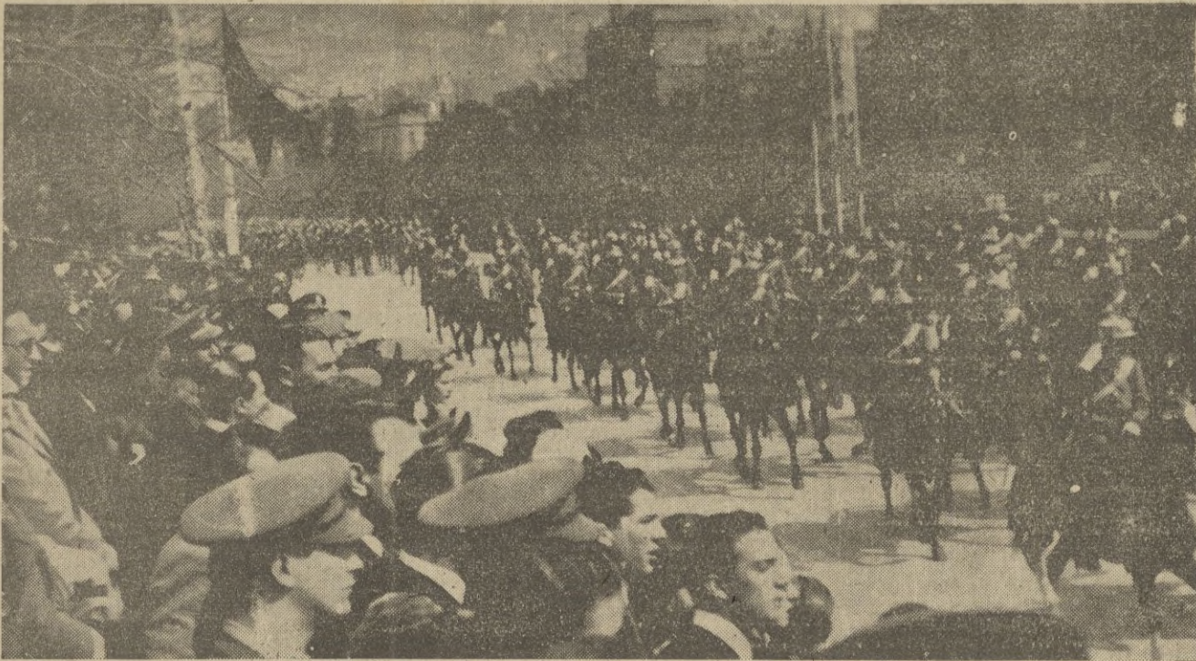
Desfile de la Caballería por el paseo de la Castellana en el Día de la Victoria.