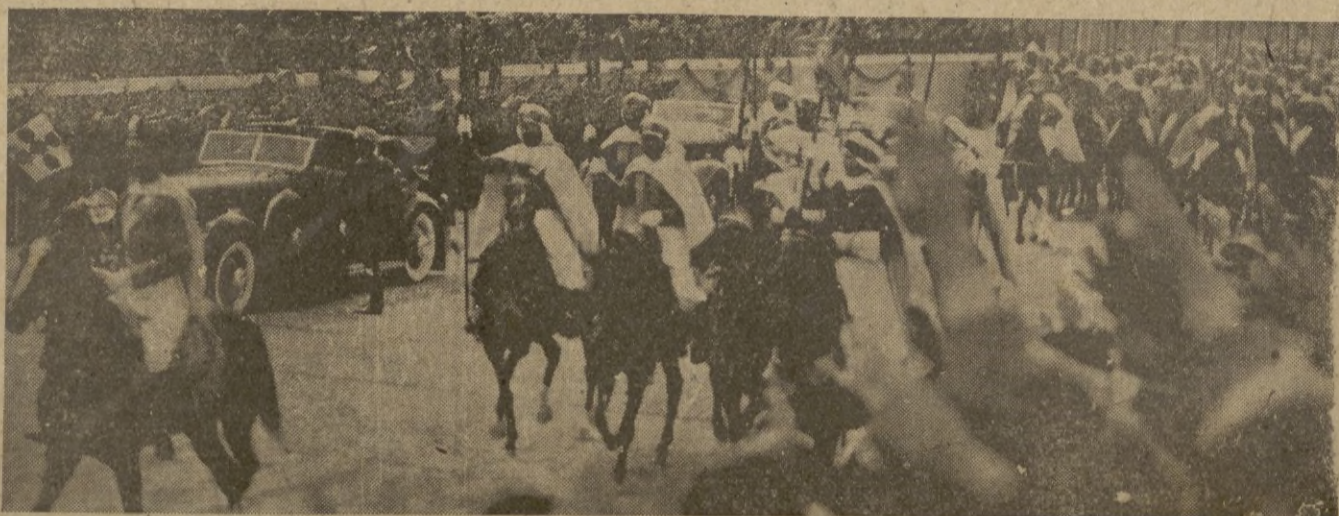
Madrid. -- Llegada del Caudillo escoltado por su Guardia mora, a la tribuna del paseo de la Castellana, para asistir al desfile.