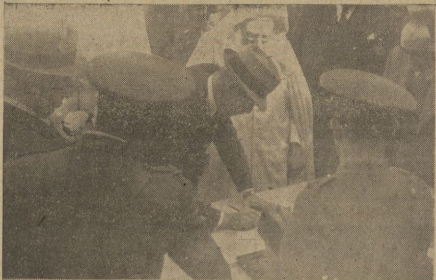
Colocación de la primera piedra para el pabellón de Puericultura y Pediatría. S. E. el Alto Comisario firmando el acta.