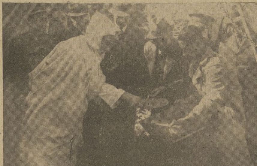
S. E. el Gran Visir echando una paletada de cemento.