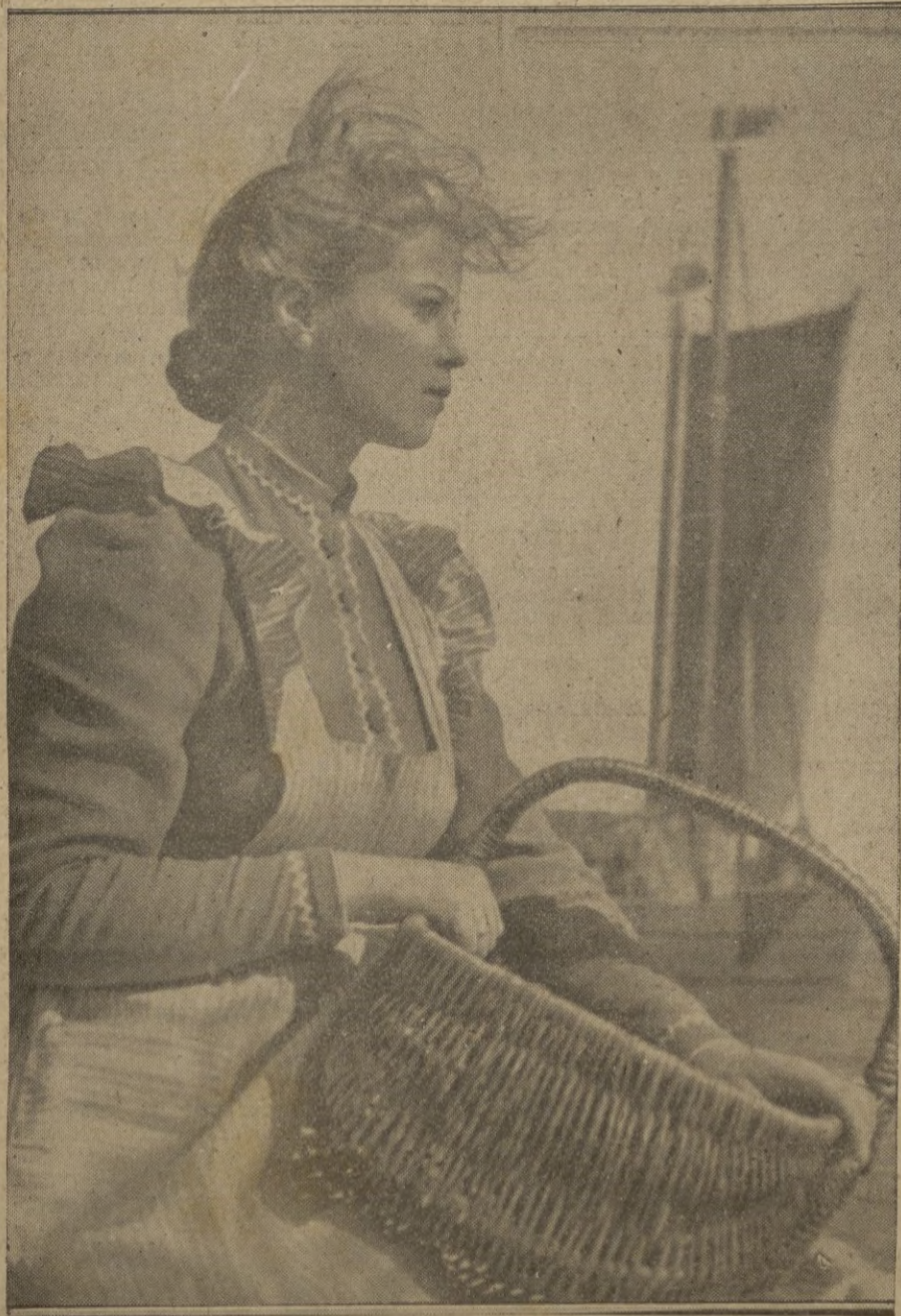
La bellísima y simpática artista Kristina Soderbaum en una escena romántica de la película de la Tobis "Viaje a Tilsit"