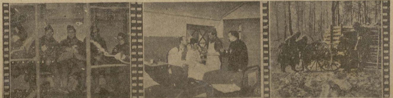
1.º-Heridos que no pierden el buen humor, y al ir hacia sus casas, ríen sa tisfechos. - 2.º - El capellán visita el Hospital y la casualidad le hace encontrar en la sala a un sacerdote herido en un brazo. - 3.º - La camilla es tá instalada sobre una carreta provista de dos ruedas, para poder conducir los heridos por la carretera.