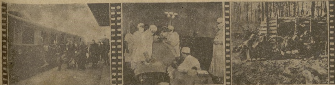
1.º-Enfermos y heridos no graves se reintegran a sus hogares. - 2.º - Se practica a un herido, delicada operación quirúrgica. 3.º - En el puerto de Socorro los camilleros reparan sus fuerzas.