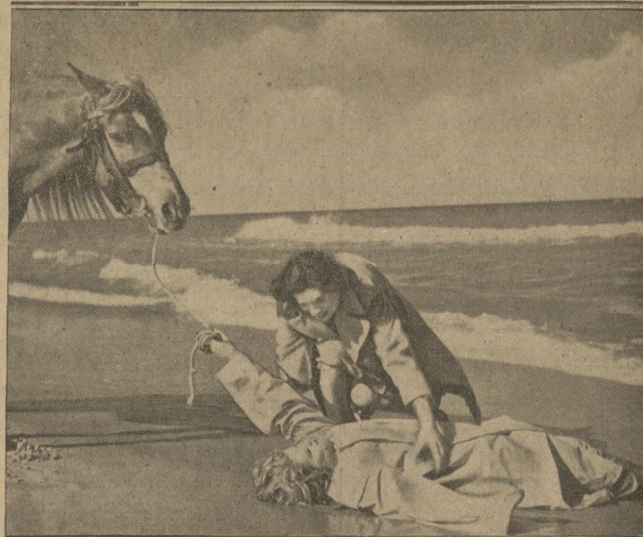
Una emocionante escena de la película de la Tobis "El viaje a Tilsit" con Kristina Soderbaum y Anna Dammann.

Mucha gente, cuando se siente feliz, rompe a cantar. En cambio, yo no soy feliz hasta que empiezo a cantar.