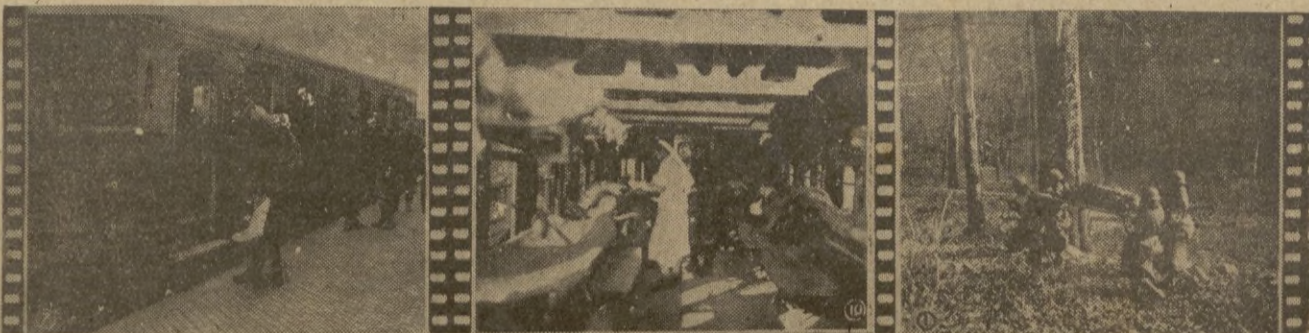
1.º - En los andenes, los heridos leves son llevados a los automotores para ser evacuados. - 2.º - Los heridos graves, viajan recibiendo los más afectuosos cuidados de las enfermeras. - 3.º - Un herido, que ha sido socorrido, es transportado después a través del bosque, cómodamente colocado en una camilla.