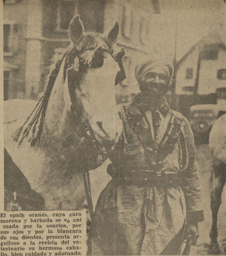
El spaih oranés, cuya cara morena y barbuda se ve animada por la sonrisa, por sus ojos y por la blancura de sus dientes, presenta orgulloso a la revista del veterinario su hermoso caballo, bien cuidado y adornado.

Granada, 5. — Se preparan con gran actividad los actos que habrán de celebrarse en el cincuenta aniversario de las Escuelas del Ave Maria. El congreso comenzará el día 16 de mayo con un discurso del Director General de Primera Enseñanza y también pronunciará una alocución el Ministro de Educación Nacional.