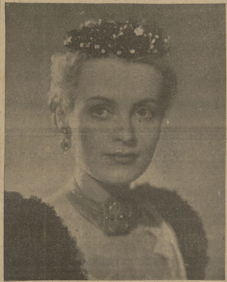
La encantadora artista Irene von Meyendorff, en la gran película de la Tobis "Casanova se casa".

Ankara, 5. — El Gobierno turco ha anunciado conversaciones con Inglaterra con el fin de obtener la seguridad de que los cuatro barcos mercantes construidos por Alemania por cuenta de Turquía, que los alemanes están a punto de entregar en el límite de las aguas territoriales, puedan alcanzar libremente las aguas turcas. Las negociaciones tratarán también de una comisión turca, que se dirigirá a Alemania para tomar la consigna de los navios. — STEFANI.