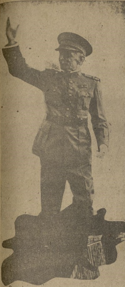
El Jefe del Estado portugués, General Carmona