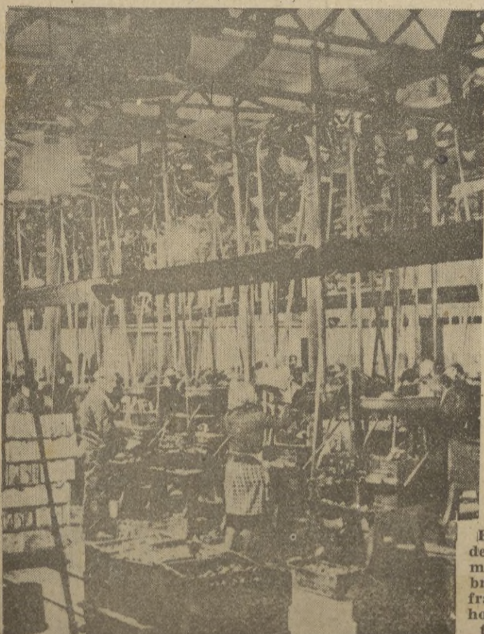
Extraordinaria red de correas de transmisión en una fábrica de cartuchos francesa, en la que hombres y mujeres trabajan juntos

Temperaturas extremas. — Máxima de 21 grados en Murcia y Sevilla; mínima de 3 en Valladolid