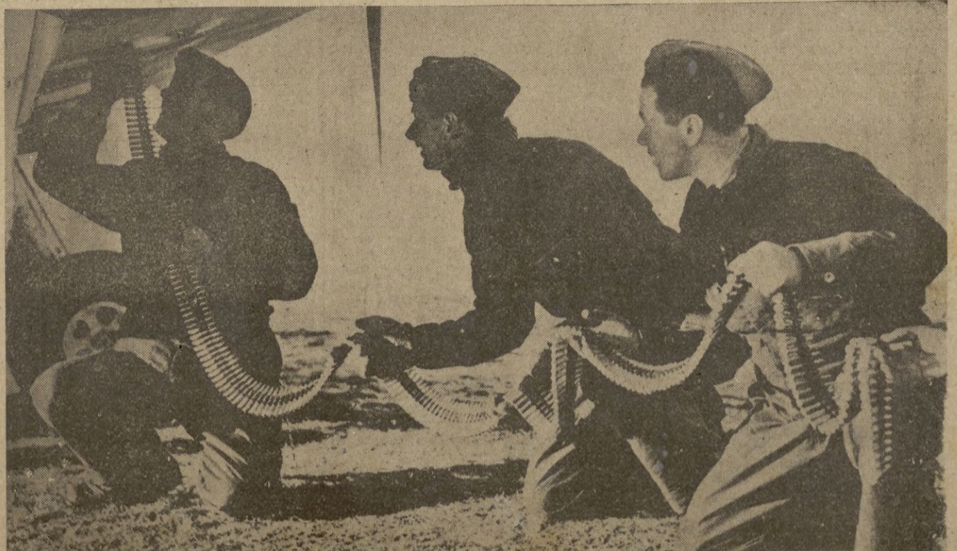
La larga tira de balas, en forma de serpiente, se introduce bajo la parte inferior del plano, para cargar una de las ametralladoras del a'a.

París, 6. — La primera sesión del nuevo Comité económico interministerial, presidida por el Vicepresidente del Consejo Chautemps, fué consagrada al examen de importantes problemas económicos y financieros, cuyo resultado será sometido a la aprobación del Consejo de Ministros. — STEFANI.