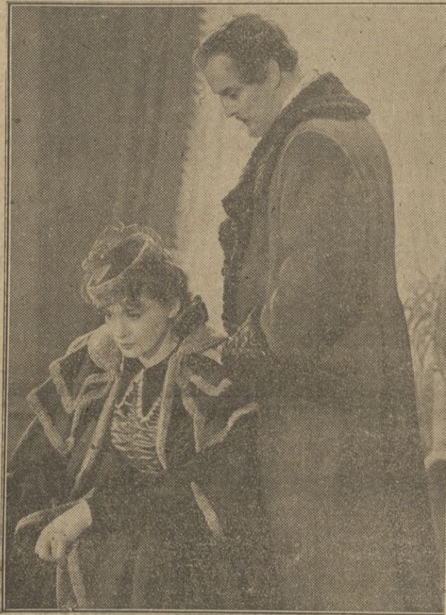
Hans Stüwe-Zarah Leander en una película de la Ufa.

La solución, cualquier día de estos, si bien anticipamos que corresponde a una conocida "estrella" de un popular estudio cinematográfico.