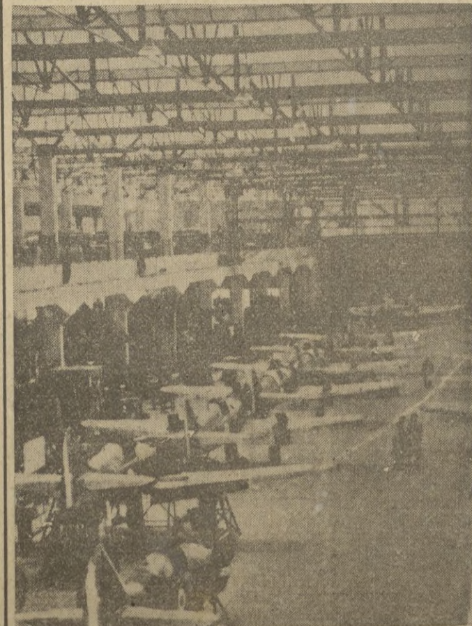
Cadena sin fin, de la que en doble fila, los aparatos de caza salen en gran serie, de una fábrica de aviación francesa.

Estas notas — escribe "Boersen Zeitung" — prueban claramente el propósito de Inglaterra de arrastrar a los dos países escandinavos al conflicto, al declarar la imposición a estos países de suspender el tráfico con el Reich y apoyar oficialmente a los aliados. — STEFANI.