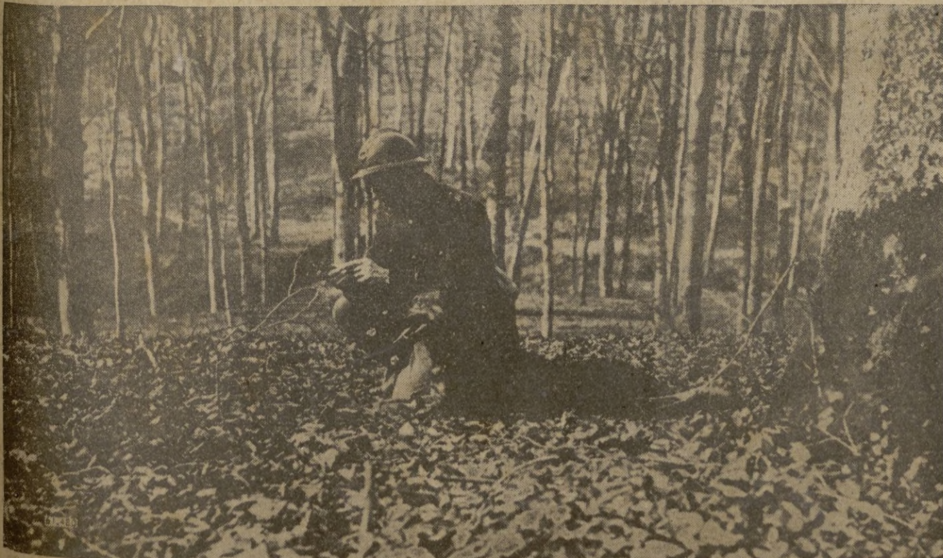
Un soldado francés con su hermoso ejemplar de perro lobo, orientándose en su marcha, en medio de un bosque

Es motivo para nosotros de honda alegría el que tan merecido ascenso le haya sido concedido, y nos congratulamos de, al presentarle nuestros respetos, ofrecerle nuestra más afectuosa felicitación.