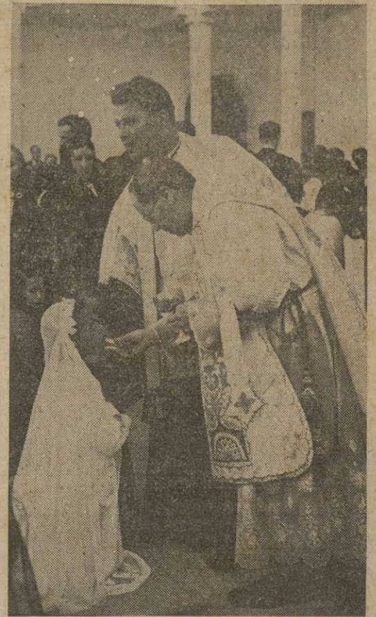
S. I. el Señor Vicario, en acto de su elevada misión