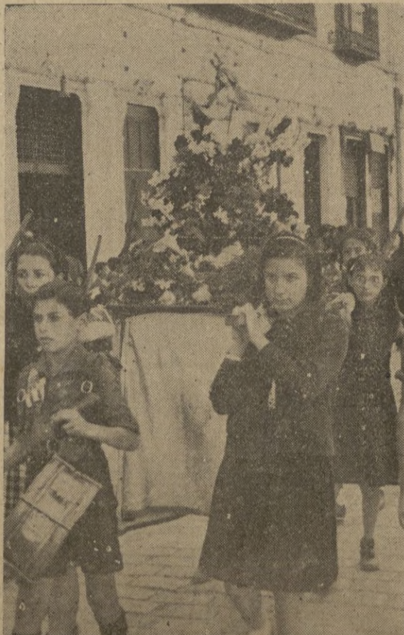
Las niñas conducen a hombros la valiosa imagen de la Virgen de Africa