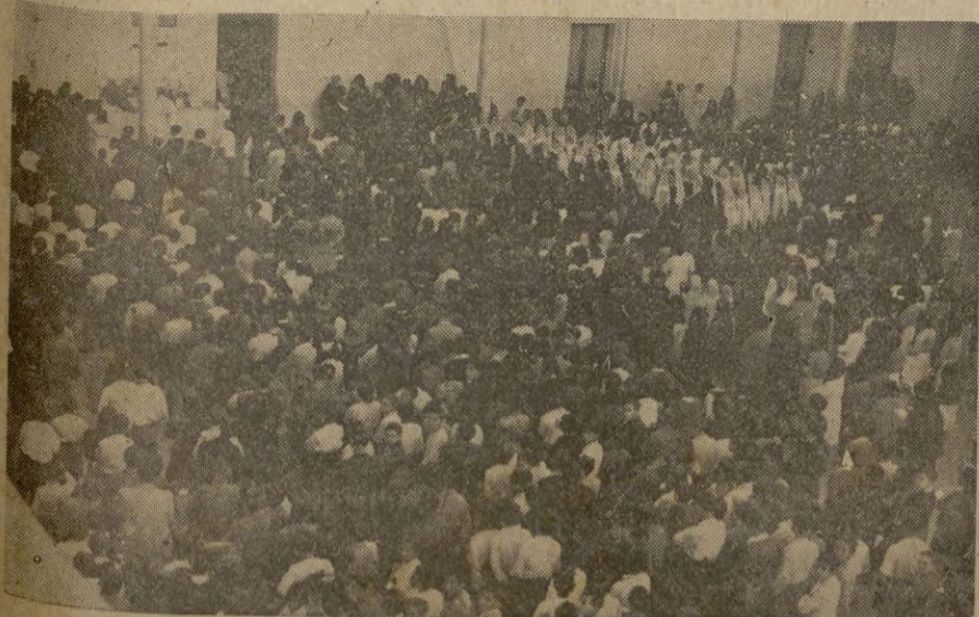
Hermoso aspecto del patio del Colegio de los Agustinos

Barcelona, 13. -- Procedentes de Madrid llegaron el Jefe de la Aviación Civil Italiana y el Director de Ala Litoria, que regresan a su país después de haber firmado en Madrid el convenio aéreo italo-español.