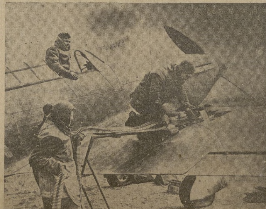
Los servidores de un rata francés colocan la cinta de su ametralladora

Precios: Preferencia, 6 pesetas. General, 3. Niños, 0'50.