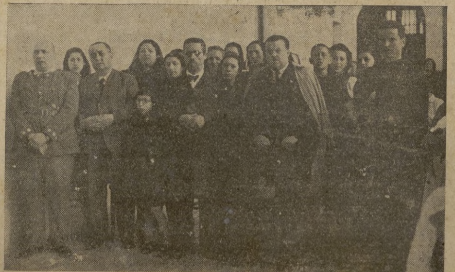
Presidencia del acto, en la misa celebrada en los Agustinos