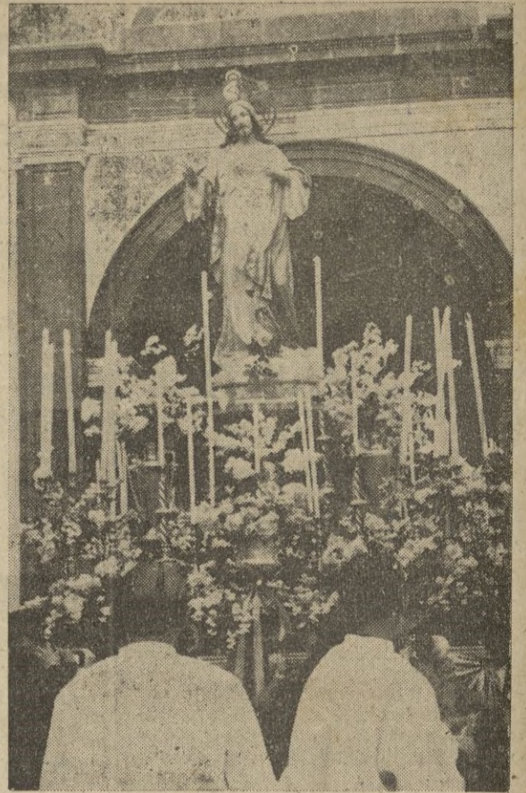
Imagen del Sagrado Corazón de Jesús, que recorrió procesionalmente en la tarde de ayer las calles de Ceuta.