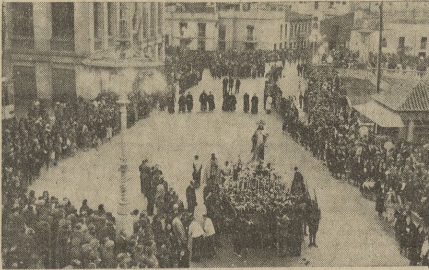
El paso del Sagrado Corazón al cruzar el Puente Almina.

El templo presentaba un hermosísimo aspecto, demostrando una vez más el pueblo ceutí su acendrada fe religiosa.