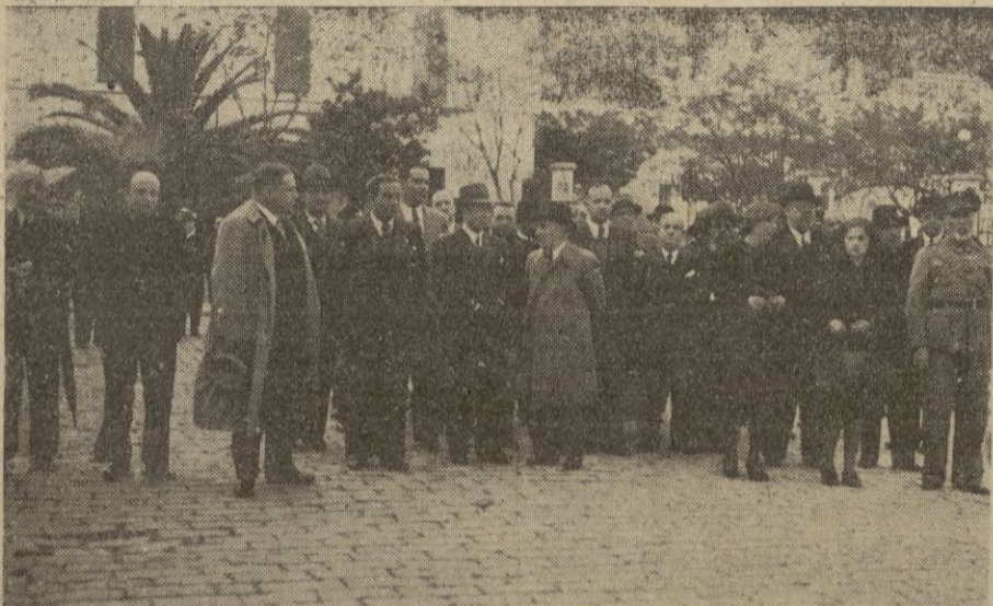
Presidencia civil en la procesión de ayer tarde