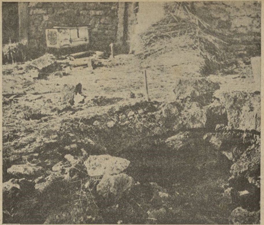
En el patio de una granja alemana un obús de 155 produce una profunda excavación.

Hará la guardia en el Palacio Real desde mañana jueves hasta el sábado, siendo los primeros soldados que desempeñan esta función, sin ser de puro origen británico. — STEFANI.