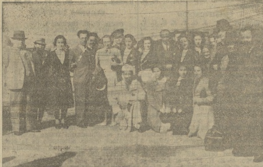
Algunos de los excursionistas llegados de Sevilla