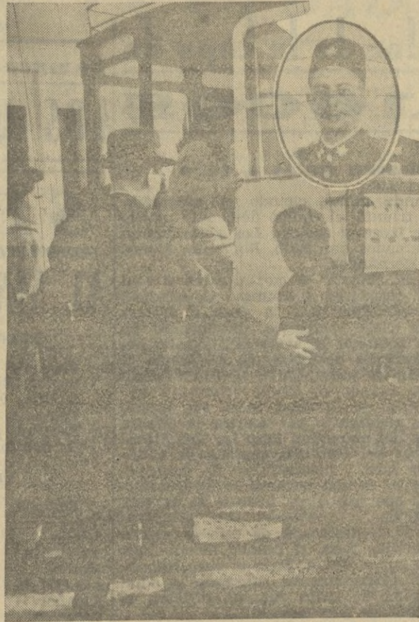
Los recién llegados en la excursión por Marruecos ocupan los asientos en el auto que ha de conducirlos al Hotel. - En el óvalo el guía del Comité de Turismo de Tetuán

Les deseamos una agradable excursión, llena de emociones simpáticas.