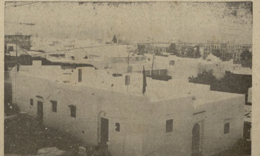
En primer término las entregadas a los musulmanes en la mañana del domingo.