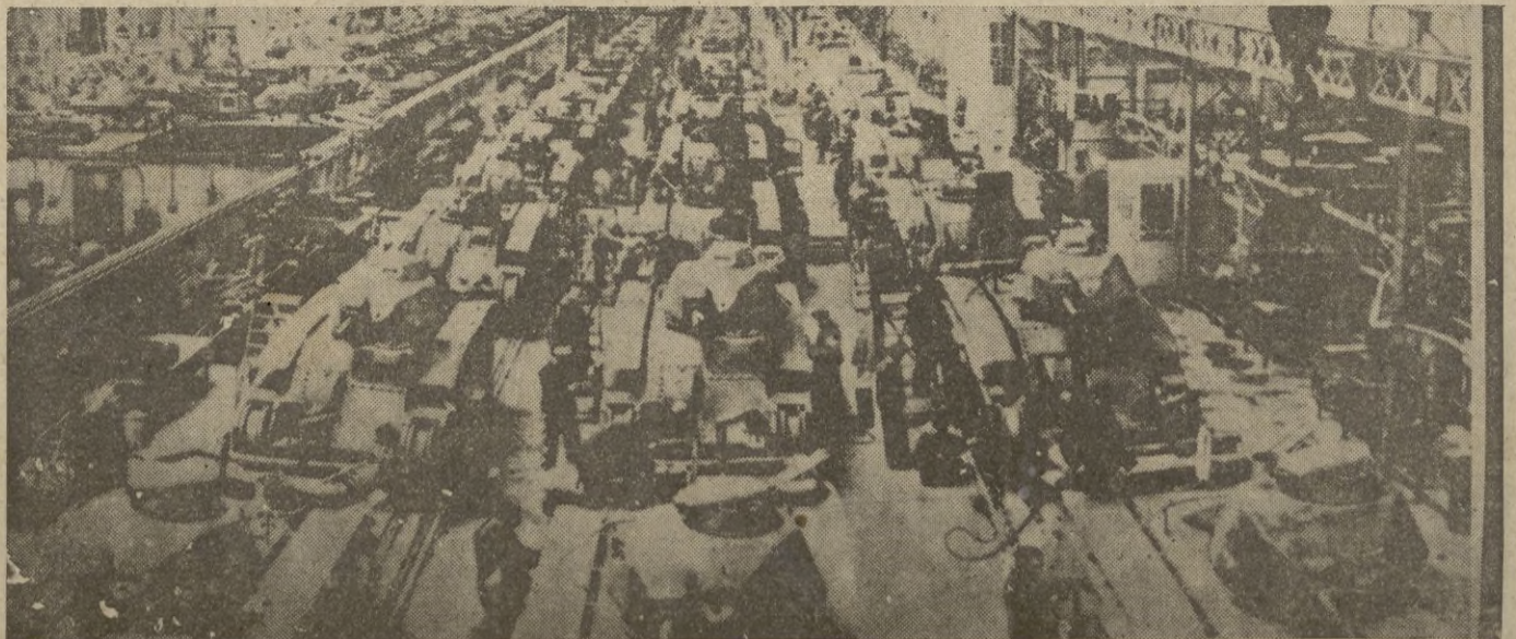
De las fábricas francesas, salen por centenares los carros de asalto, por millares los obuses y por millones los cartuchos.

La Deuda Pública nacional ha alcanzado la cifra de 8.231 millones de libras esterlinas. — STEFANI.