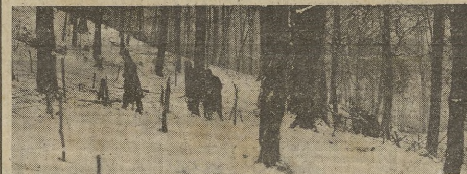
Subiendo las pronunciadas pendientes del bosque nevado, la patrulla francesa inspecciona las avanzadas de sus posiciones.

SE SUSPENDE POR ESTE AÑO LA CONSTRUCCION DE CUARTELES EN SUEZ