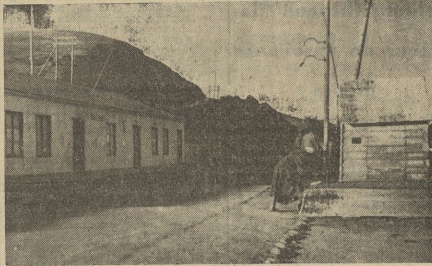
A la izquierda, las viviendas de los funcionarios de servicio. A la derecha, la garita que sirve de refugio a los que montan el servicio.

El cabo de Carabineros y personal de servicio el día de nuestra visita al Tarajal.