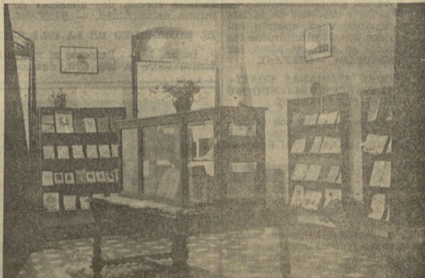
Un detalle del salón.