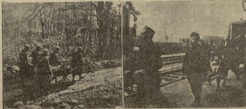
(Izquierda).-La ambulancia se dirige conduciendo un herido francés, hacia la estación del ferrocarril. -- (Derecha). - Los enfermeros hacen objeto del mayor cuidado a los heridos que conducen.

Londres, 24. — A propósito de la entrevista de ayer entre el Embajador de la U. R. S. S. en Londres y el Subsecretario de Relaciones Exteriores, Butler, se declara en los círculos (Pasa a la última página.)