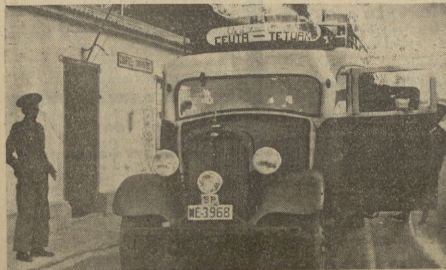
Uno de los autobuses que diariamente hacen el servicio a Tetuán, es objeto de la obligación requisada.