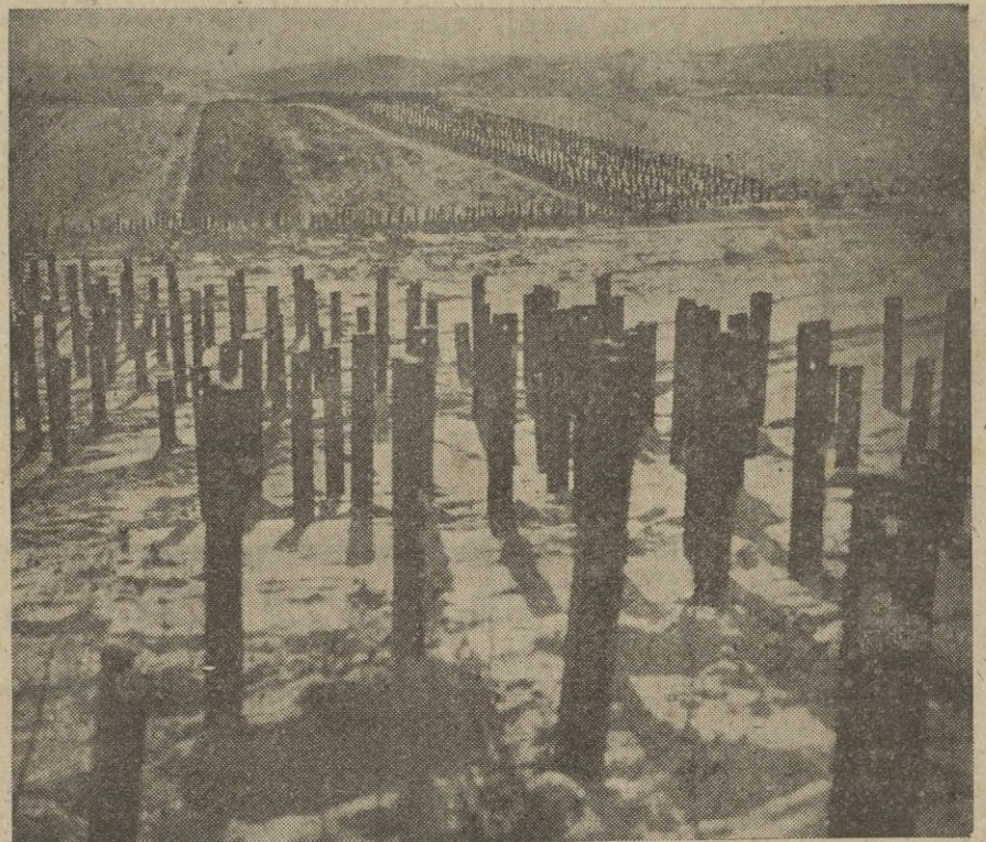
Entrada a una de las fortificaciones de la línea Maginot, y una barrera de postes, an titanques.

Los alemanes poseen, además, toda Noruega meridional y central, así como los centros vitales y las vías de comunicaciones. — STEFANI.