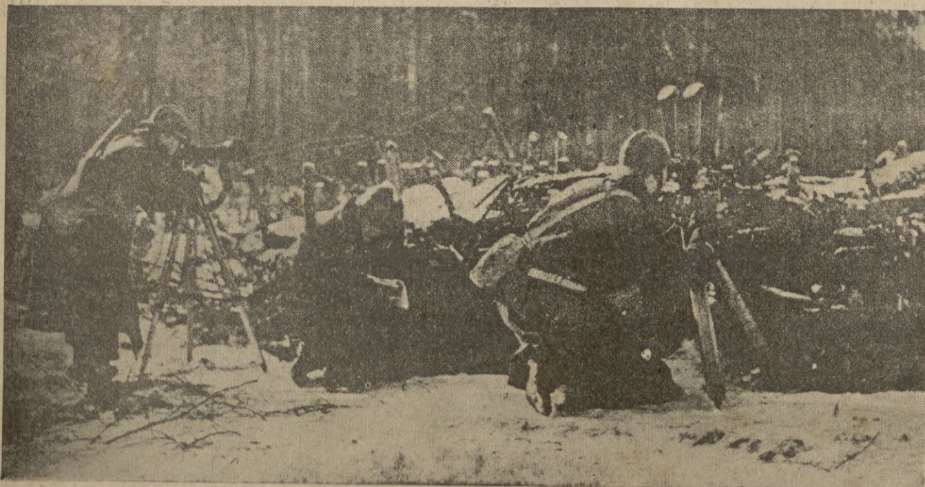
Disimulada por las prominencias del terreno, un puesto francés de observación se halla dispuesto a seguir la acción guerrera.

"La noche última y durante la jornada de hoy se han rechazado varias patrullas alemanas, al Oeste de los Vosgos, fracasando un ataque local del enemigo". — STEFANI.