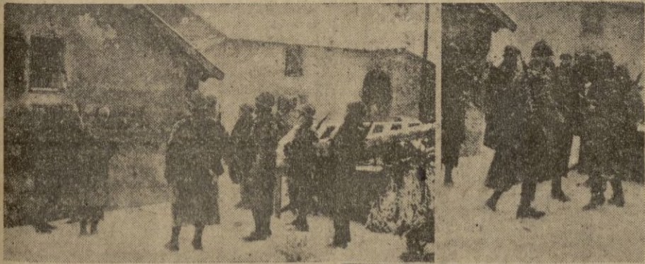
(Arriba): Un corte en la línea telefónica es reparado con toda rapidez. Rápidamente se saca una derivación telefónica del aparato portátil que transporta uno de los soldados.

Concluye diciendo que los ingleses pueden deducir que la acción de la aviación alemana en Noruega, es tan