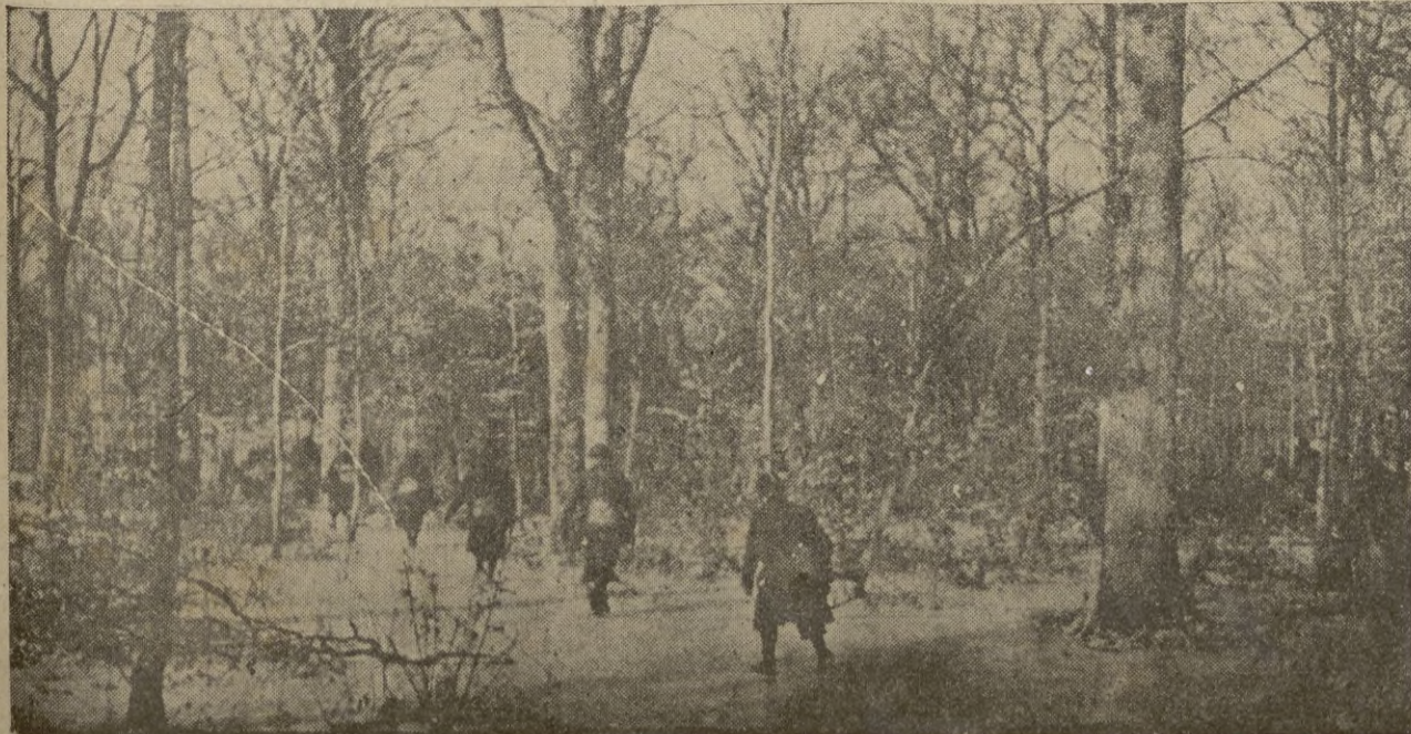
Una compañía francesa, en columna de sección, se dirige atravesando un bosque, al lugar que les fué señalado.

Al acto, asistieron además distintas personalidades literarias y numerosos periodistas. — STEFANI.